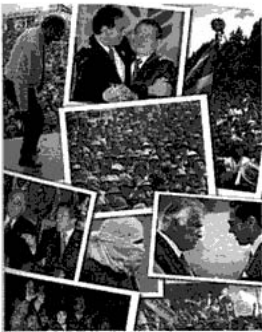
Portada: Fotos archivo diario HOY