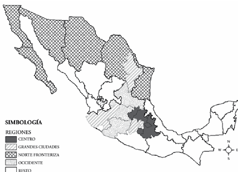
Mapa 1: “Expresión geográfica de la regionalización” 12

Tomando en consideración estas etapas puedo concluir que la subcultura de la maquila tiene dos aristas positivas (más adelante hablaré de las negativas). La primera de ellas consiste en que al convertirse la mujer en un sujeto económicamente activo, los roles sociales conservadores y tradicionales empiezan a cambiar: la mujer tiene más libertades económicas, responsabilidades profesionales, no sólo familiares, e incluso otras formas de establecer relaciones personales y de pareja. La segunda fundamenta el desarrollo en la región de la manufactura mexicana, sobre todo en las últimas tres décadas, como lo expone con bastante claridad Adrián de León Arias, en su texto “Cambio regional del empleo y productividad manufacturera en México. El caso de la frontera norte y las grandes ciudades: 1970-2004”, donde compara el desempeño económico de cuatro regiones de la República Mexicana, como se puede observar en el siguiente mapa.