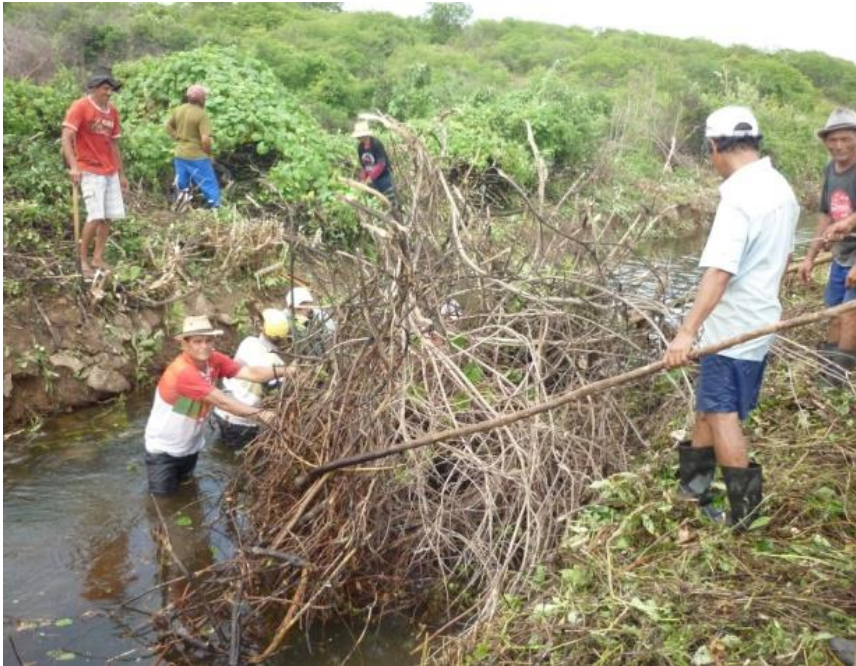
Figura 03: Retirada de entulhos do canal de adução pelos irrigantes.