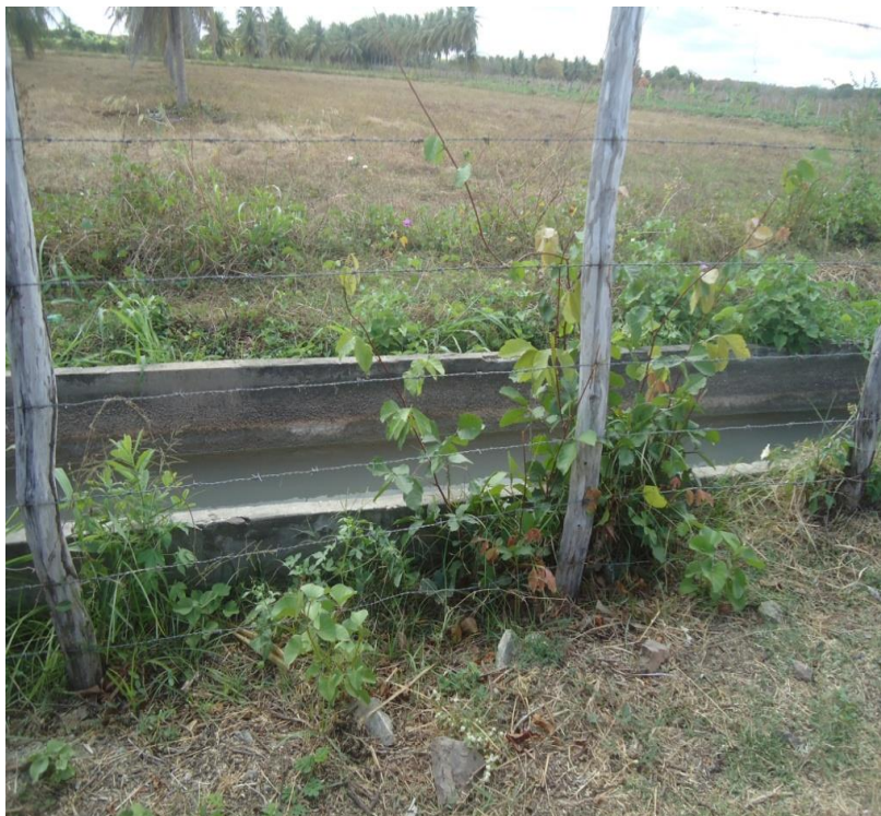
Figura 02. Área Irrigável abandonada.

Fonte: Maria Erileuda Brito Teixeira (Agosto-2013)