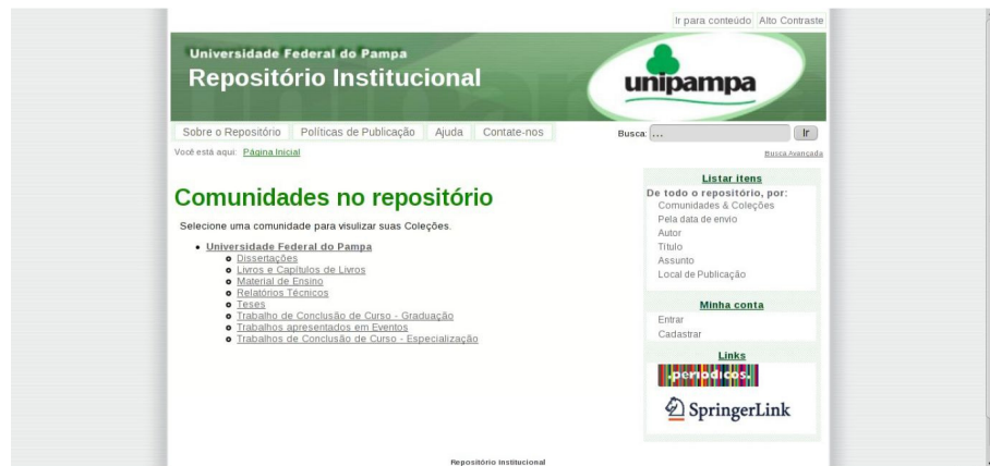
Figura 3 – Página principal de um protótipo de alta fidelidade