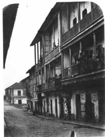
Figura 4. Calle de Las Monjas, Barrio San Felipe, Casco Antiguo, Panamá. Rafael Castro y Ordoñez, 1863. Museo Nacional de Ciencias Naturales (CSIC), Madrid. ACN 001/021/346.

El 12 de agosto de 1863, arribó a nuestras costas la Expedición Científica del Pacífico. Entre los miembros de la Expedición estuvo el fotógrafo y dibujante Rafael Castro y Ordoñez , nacido en Madrid. Castro además de las valiosas descripciones acerca de Taboga y del barrio de San Felipe (Figura 4), dejó importantes fotografías entre las primeras que se conocen de estos sitios.