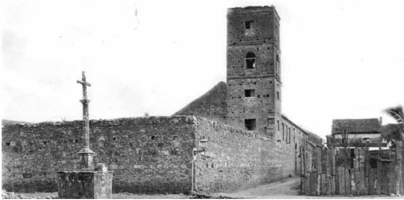
Figura 5. Convento de las Monjas de la Concepción, Casco Antiguo, Panamá. Eadweard Muybridge 1875.

Otro de los fotógrafos reconocidos que nos visitaron fue Eadweard Muybridge . Uno de los fotógrafos más destacados de todos los tiempos. Mostró al mundo las primeras fotografías donde se captaba el movimiento. Estuvo en Panamá entre marzo y noviembre de 1875 y dejó una importante colección de vistas del Istmo (Figura 5).