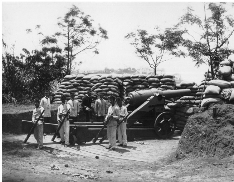
Canhão no alto do Morro do Castelo durante a Revolta da Armada, em 1893.

Durante três meses assistir-se-ia na baía do Rio de Janeiro a um verdadeiro duelo de artilharia regulado, tiro por tiro, pelas testemunhas reunidas a bordo de um dos navios de guerra estrangeiros. São elas que dirão, quase diariamente, a cada um dos combatentes o que lhes é lícito e o que lhes é defeso, o que cabe e o que não cabe no acordo que fizeram; são elas que marcarão a raia do tiro; que observarão d'onde partem as provocações; que decidirão, em uma palavra, as questões ocorrentes, tudo como os padrinhos em uma pendência de honra (NABUCO: 1896,27).