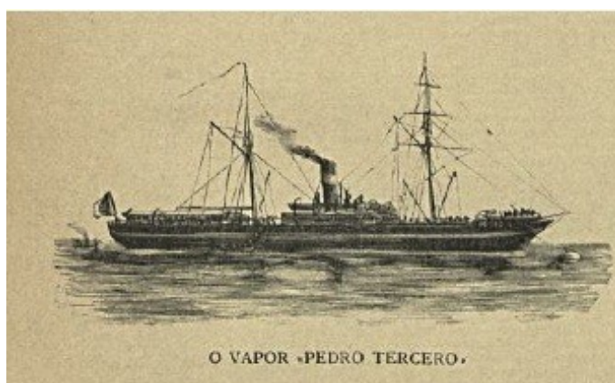
Ilustração do vapor Pedro III .

Logo após o incidente diplomático envolvendo a Pepito Donato , o comandante Augusto de Castilho deu ordem para que as corvetas saíssem das águas territoriais argentinas e rumassem para as águas territoriais uruguaias. O planejamento era aguardar que o transporte Pedro III , fretado pelo Visconde de Faria junto ao comerciante estadunidense D. Pedro Gartland, em Buenos Aires, ficasse pronto para rumar até a ilha inglesa de Ascensão, escoltado no percurso pela corveta Affonso d'Albuquerque . Nesta ilha, o transporte português Angola estaria aguardando a chegada do Pedro III para transladar os asilados para o seu bordo e completar a viagem até Lisboa. A corveta Mindello permaneceria em Buenos Aires até completar os seus reparos e estar em condições de realizar a travessia atlântica (SÁ: 1894, 332-333, vol. III).