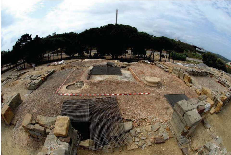
Figura 3.- Horno tardío en uno de los cubicula.

cubicula , mientras que en la parte trasera, hoy desaparecida, pudo localizarse el tablinium , alineado en el eje entrada- atrium , aunque se trata de una mera hipótesis.