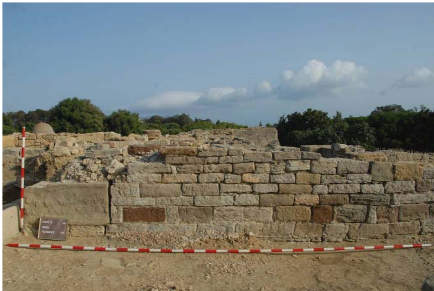
Figura 5.-Alzado de uno de los muros del fauces.

La aplicación de la fotogrametría supone un método de reconstrucción tridimensional muy significativo para la realización de estudios arqueoarquitectónicos, ya que permite un nuevo enfoque para el estudio de los paramentos y sus técnicas constructivas. Estos trabajos –actualmente en ejecución– serán de gran utilidad a la hora de plantear hipótesis de reconstrucción del edificio objeto de estudio.