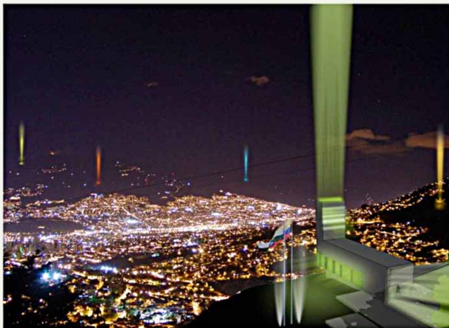
Figura 3. Visualización del proyecto de las estaciones de policía o CAI periféricos, con faros, para la vigilancia urbana.

Lo anterior puede entenderse como el ejercicio del poder “desde abajo” (Foucault, 1991), mediante la creación de subjetividades ciudadanas alrededor de las condiciones bajo las cuales el habitante de los sectores populares puede acceder a la ciudad. Su alcance, sin embargo, está limitado a los “informales” mas no a los grupos y organizaciones ilegales. Para esto existe una estrategia represiva complementaria, consistente en la implantación de establecimientos de las fuerzas policiva y militar (figura 3). La normalización de la vida barrial a través de los Metrocables tiene su complemento en la pacificación represiva.