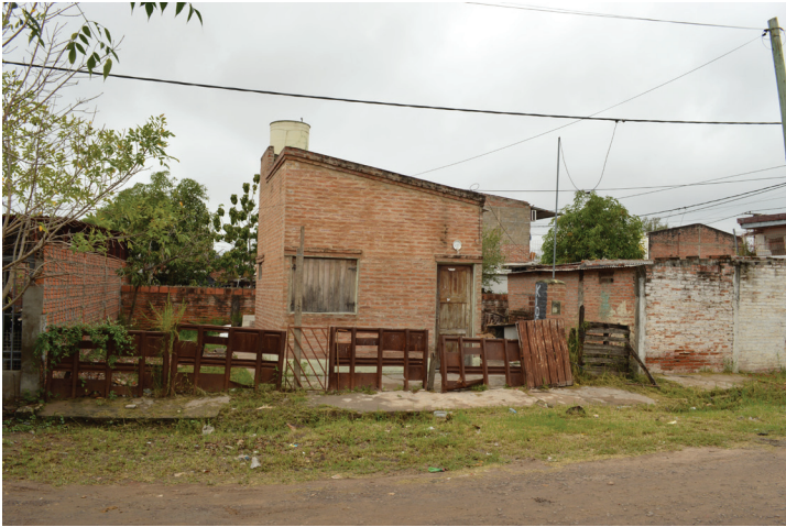
Foto 1. Intervención del PFMV en Villa Odorico.