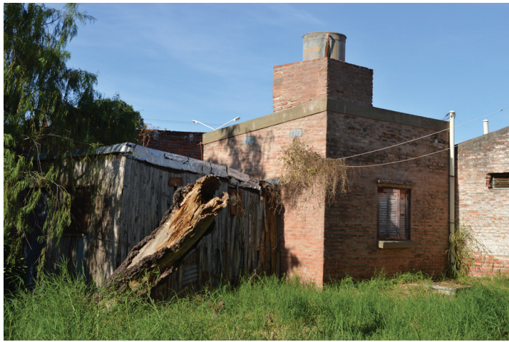
Foto 2. Intervención del PFMV en Villa Itatí.