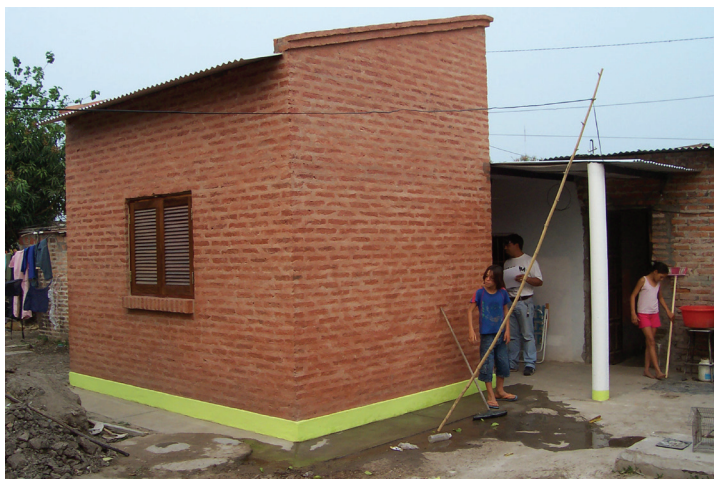
Foto 3. Intervención del PFMV en Villa Luzuriaga.

Con relación a lo anterior se viene planteando una metodología que permite analizar los resultados del Programa Federal de Mejoramiento de Viviendas “Mejor Vivir” en el Área Metropolitana del Gran Resistencia, una de las zonas con mayores índices de pobreza e indigencia del país y escenario, luego de la crisis que atravesó la Argentina en 2001, donde se ejecutaron soluciones habitacionales de un importante número de programas del Plan Federal de Vivienda (Subsecretaría de Desarrollo Urbano y Vivienda, 2005-2010).