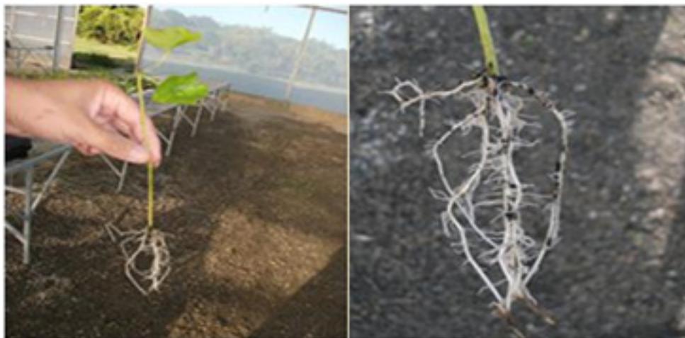
Figura 2. Estacas de inhame ( Dioscorea spp.) com raízes bastante desenvolvidas.

1A e 2). Essa tendência mostra, possivelmente, que estacas mais juvenis em termos fisiológicos, enraizam melhor do que aquelas oriundas de andares mais altos que são cronologicamente mais novas, mas fisiologicamente mais maduras.