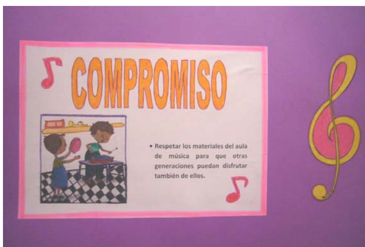
Figura 1. Ejemplo de propuesta solidaria