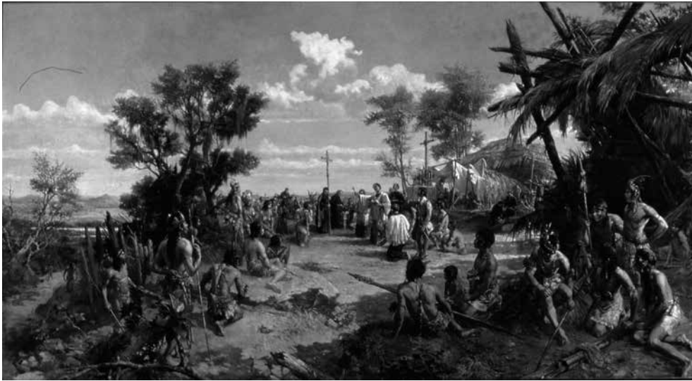
Imagem 1. Fundação de São Paulo (1907)

Fonte: Oscar Pereira da Silva, Fundação de São Paulo , 1907, óleo sobre tela, 185 x 340 cm, Museu Paulista da Universidade de São Paulo (Brasil). Reprodução fotográfica José Rosael e Hélio Nobre.