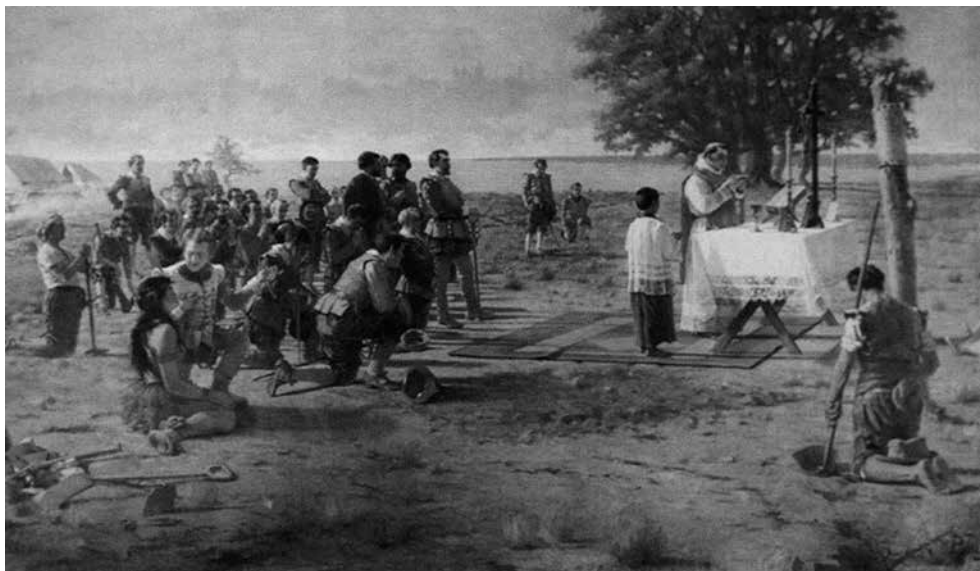
Imagem 3. La primera misa en Buenos Aires (1910)

Fonte: José Bouchet, Primera Misa en Buenos Aires , 1910, óleo sobre tela, 393 x 202 cm, Museo Histórico Nacional (Buenos Aires).