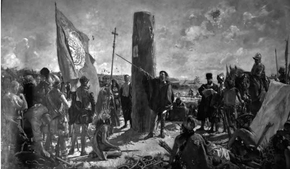
Imagem 5. La fundación de Buenos Aires (1924)

Fonte: José Moreno Carbonero, Fundación de Buenos Aires , 1924, óleo sobre tela, 250 x 400 cm, Palacio de la Municipalidad (Argentina). Reprodução fotográfica de Michelli Monteiro.