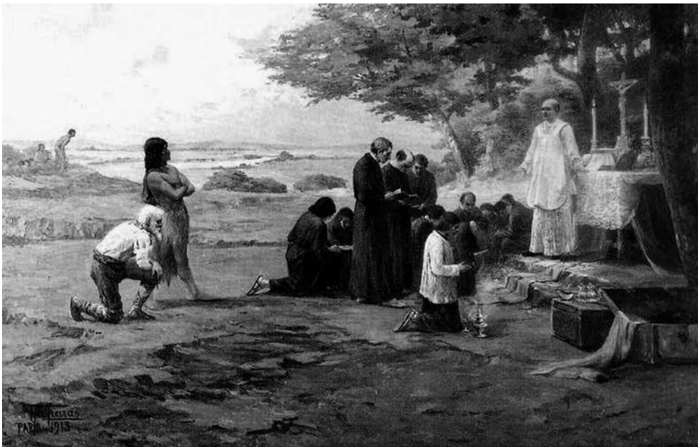
Imagem 2. Fundação de São Paulo (1913)

Fonte: Antônio Parreiras, Fundação de São Paulo , 1913, óleo sobre tela, 200 x 300 cm, Prefeitura de São Paulo (Brasil).