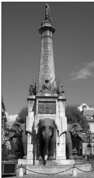
Place Benoît-de-Boigne, Chambéry

présente à sa base quatre ‘bustes’ d’éléphants (regardant les quatre points cardinaux) autour d’une colonne surmontée de la statue du grand homme. Comme on le voit sur la photo ci-dessous, les sculptures ne présentent que la partie antérieure des animaux, et le surnom local donné à ce monument (et, par extension, à la place Benoît-de-Boigne, dite encore «Place des éléphants») est «les quatre sans cul» (formant lui-même un jeu de mots avec : «(faire) les 400 coups»). Seuls les Chambériens (ou les initiés) font instantanément le rapprochement entre la place et le nom du magasin.