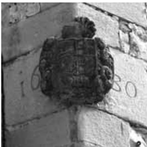
Façana de la casa del Marquès de Capmany al carrer Major de Cervera.