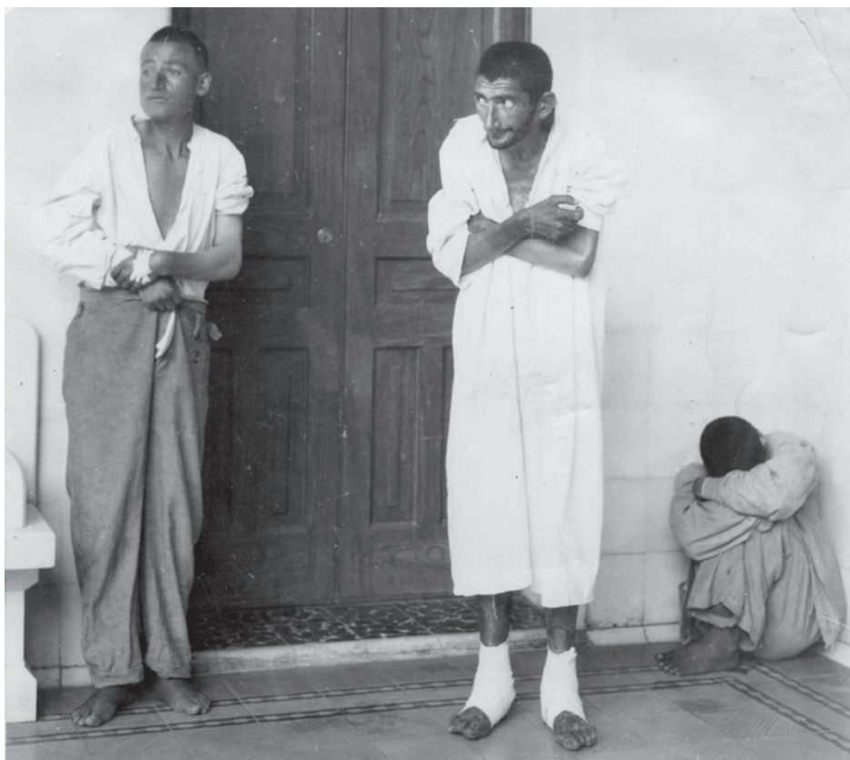
“Grupo de esquizofrénicos, retrato” (impresión plata sobre gelatina (entonada y manipulada: 10.2 x 12.7 cm.), México, D.F, c. 1940. No. Inv. 461041.