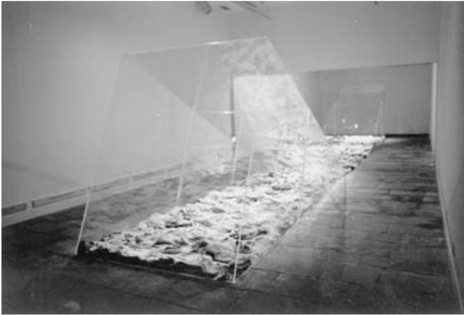
FIG. 8. Concha Jerez , Caixa de Quotidianitat, Sala de la Fundació Caixa de Pensions, Barcelona, 1988.