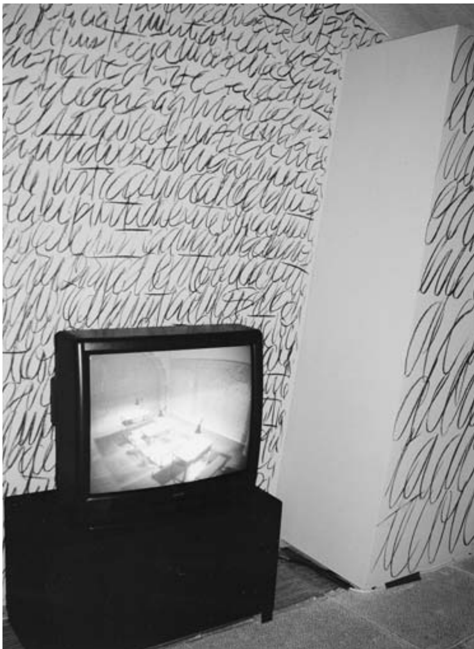
FIG. 6. Concha Jerez, La Fosca de Mirall (fragmento 2) , Can Palauet , Mataró, 1997.