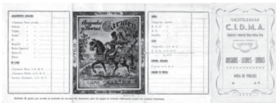
Pieza catalogada con el nº 712 del inventario