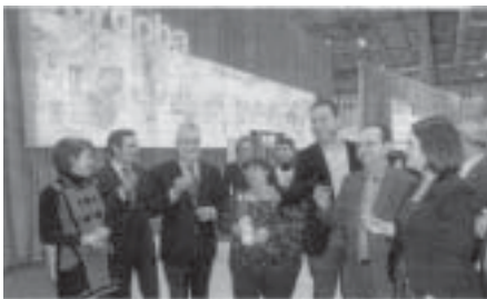
El Presidente de la Junta de Andalucía, José Antonio Griñán, brinda con anís de Rute, junto al consejero de Turismo y autoridades locales. Diario Córdoba, Jueves 31 de Enero de 2013

2º) Abril de 2013 Dos acciones promocionales en la zona del Levante