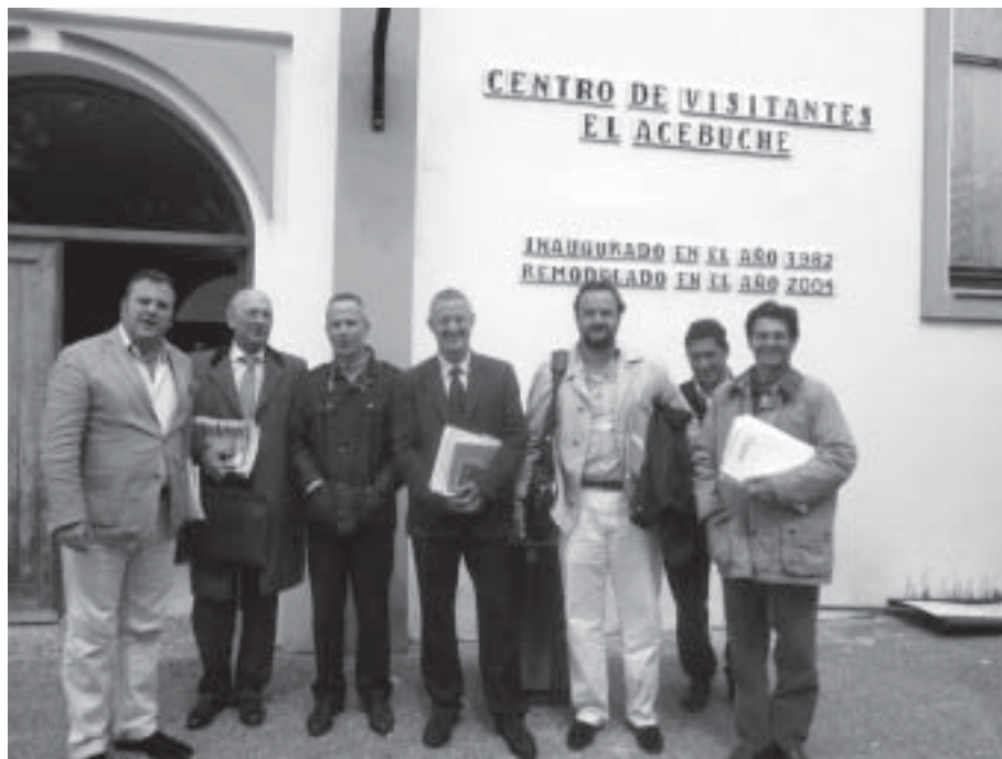
Imagen de las jornadas en el parque nacional de Doñana