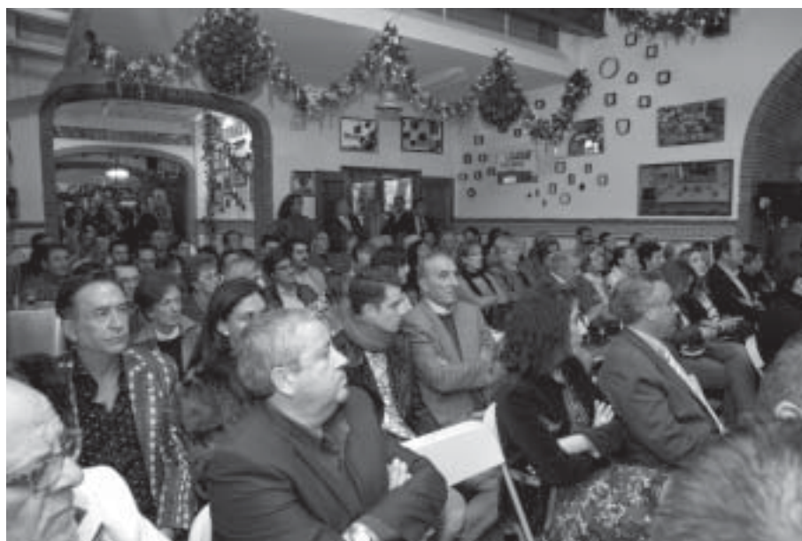
Aspecto que presentaba la sala de usos múltiples, en el acto de presentación de la Campaña de Navidad 2013

6º) Durante el otoño 2013 se sucedieron diversos desfiles procesionales con motivo del Año de la Fe en la puerta del Museo montando sendos altares al paso de las Hermandades. Ntra. Sra. del