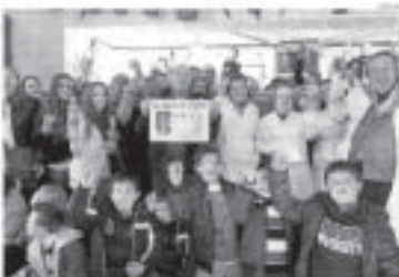
Entrega de un botellín de Rute a un ganador de la lotería.

La hermandad del Carmen y el Museo del Anís distribuyeron 1.300 botellines de Rute. El premio principal, de 42.812 euros, fue repartido entre los ganadores de la lotería. El acto se celebró en el salón de actos de la hermandad del Carmen y el Museo del Anís. El premio principal, de 42.812 euros, fue repartido entre los ganadores de la lotería. El acto se celebró en el salón de actos de la hermandad del Carmen y el Museo del Anís.