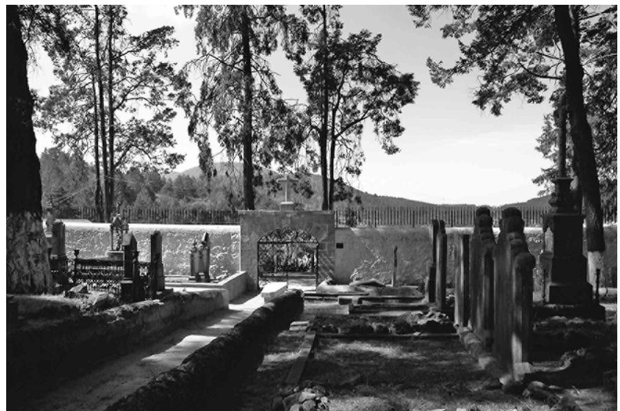
FIGURA 3. Panteón Inglés. Profundidad espacial; fotografía: Lameda 2009.

que se puede definir como fundacional, localizada en el corazón del sitio, donde se encuentran las tumbas de los primeros fallecidos –desde 1834 hasta finales del siglo XIX–, con características formales e iconográficas del lugar de procedencia de los migrantes extranjeros. Llama la atención la ausencia de rasgos culturales locales. Por ejemplo, hay lápidas pétreas ornamentadas en posición vertical con inscripciones, sarcófagos de piedra también con inscripciones en la parte superior y montículos de tierra contenidos por un cinturón de piedras, que posiblemente tuvieron una cruz de madera o algún elemento en donde se plasmaba el epitafio, hoy perdido. En todos los casos la invasión de flora ha logrado un sincretismo con las tumbas.