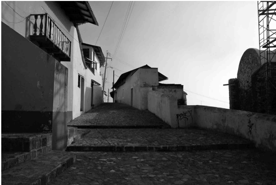
FIGURA 2. Real del Monte. Riqueza de texturas, colores y formas; fotografía: Lameda 2009.

Todo ello está impregnado con las huellas de un pasado minero que conforma un patrimonio industrial, testimonio de su memoria histórica. Y al final de un camino sinuoso franqueado por encinos centenarios, se alza nuevamente el cementerio, como parte de la experiencia minera del lugar.