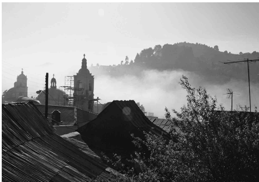
FIGURA 1. En primer plano el poblado de Real del Monte; al fondo cerro del Inglés donde se emplaza el Panteón Inglés. Una mañana de abril cuando la neblina cubre todo a su paso; fotografía: Lameda 2009.