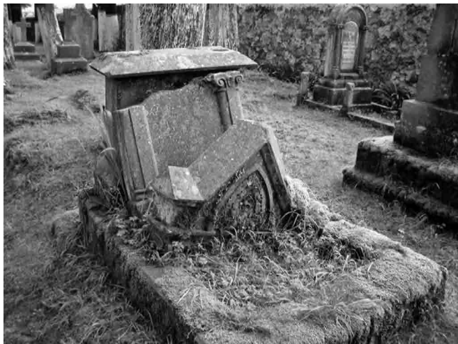
FIGURA 4. Panteón Inglés. Sincretismo entre las tumbas y la naturaleza.

por su alta producción de plata, que correspondía con la fecunda marcha que había caracterizado a la minería novohispana. Dada su condición colonial, la producción estaba destinada para usufructo exclusivo de la corona española, situación que cambió de manera radical con las guerras de independencia en los inicios del siglo XIX (Marichal 2006).