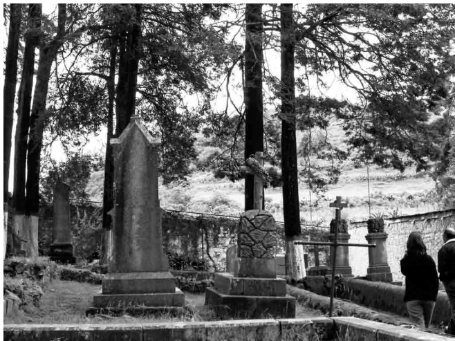
FIGURA 5. El Panteón Inglés y el entorno natural; fotografía: Lameda 2009.

municipales, instituciones públicas, organizaciones sociales, así como la corresponsabilidad de los ciudadanos de Real del Monte.