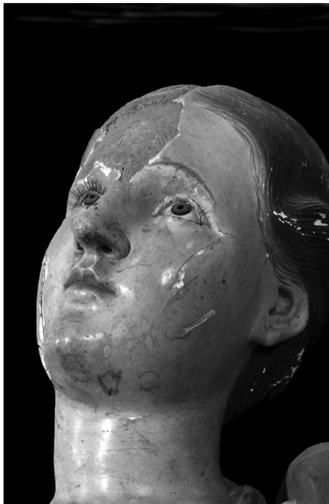
FIGURA 1. Santa Bárbara, madera policromada y estofada, siglo XVIII.

datación, la caracterización, la prospección y la simulación en computadora, entre otras.