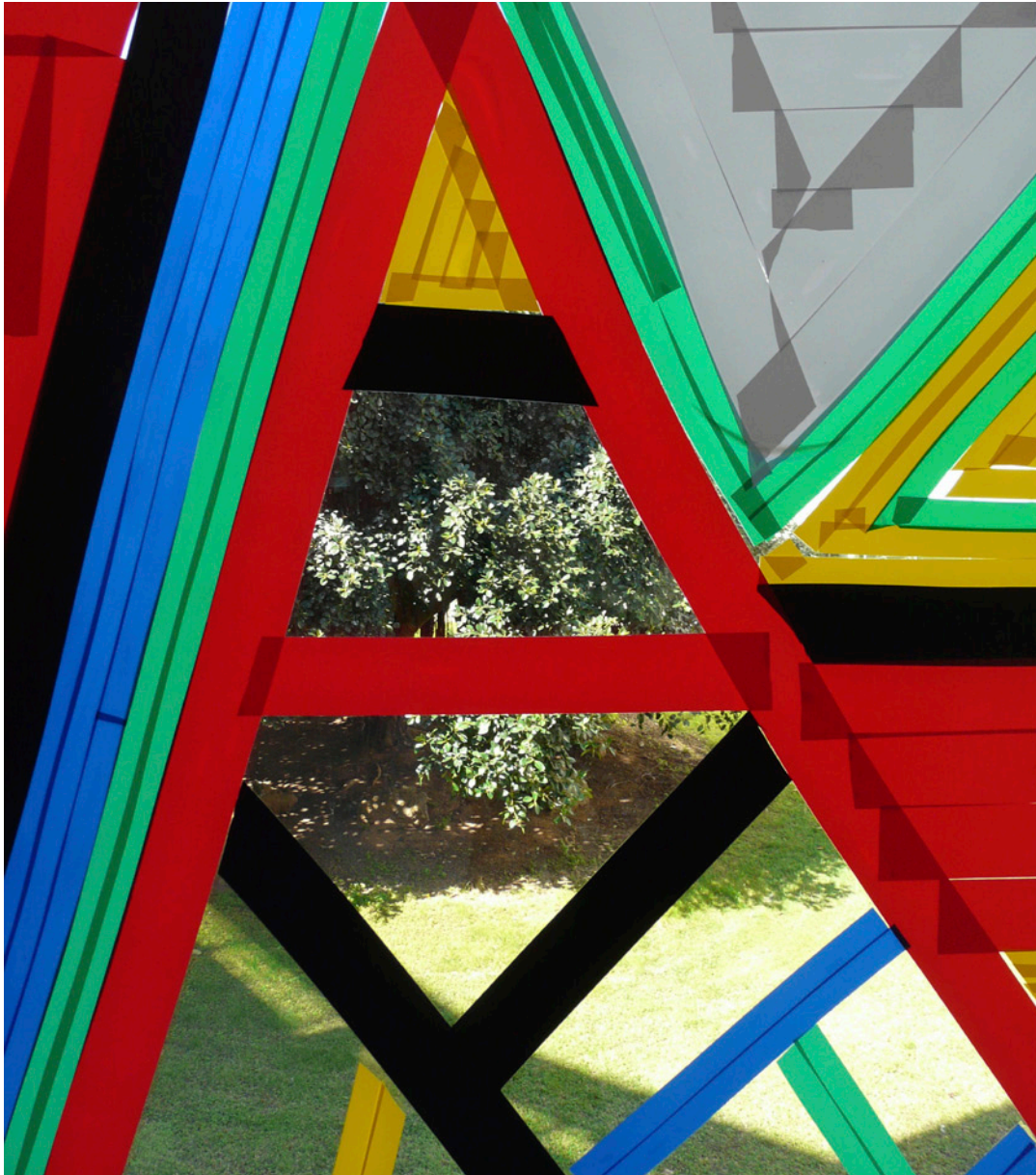
Fotografía independiente. Palau-Pellicer, Paloma (2014) Aulario y cintas adhesivas (IV) .