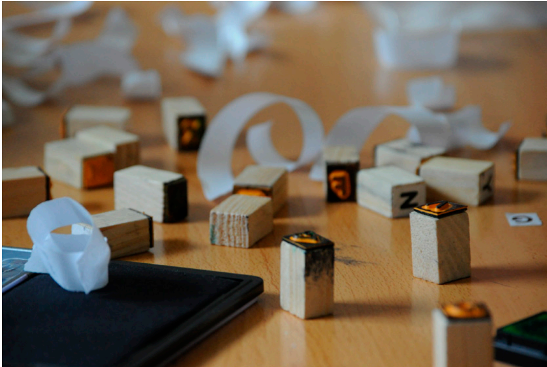
Fotografía independiente. Andreu Castelló, Miquel (2014) Taller de papel y tipos .

En estas investigaciones, los datos, las ideas, los argumentos y las conclusiones son fundamentalmente imágenes visuales de calidad artística profesional. Su propósito es aproximarse a los problemas educativos a través de medios no basados en el texto, y aportar nuevas soluciones a estos problemas.