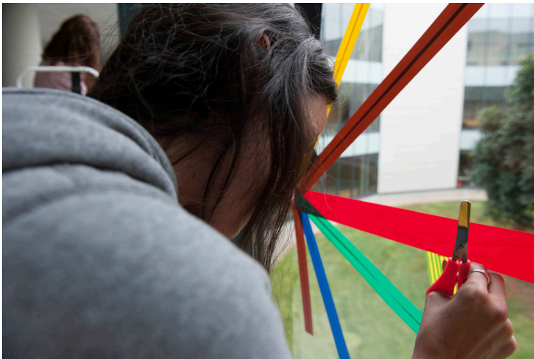
Fotografía independiente. Álvarez Fernández, Berena (2014) Aulario de la Universitat Jaume I de Castellón .

época para dedicarse, no sólo profesionalmente a la creación plástica, sino también para formarse y mostrar su obra. Desde el cine, Belmonte propone un texto crítico vinculado a las cuestiones de co-educación audiovisual y de género. El autor alude a imágenes estereotipadas de la feminidad, como el llamado «ángel del hogar», en el arte cinematográfico narrativo, mencionando también su pervivencia en los estereotipos de género de las imágenes televisivas más recientes, cuya ficción es heredera directa del arte cinematográfico.