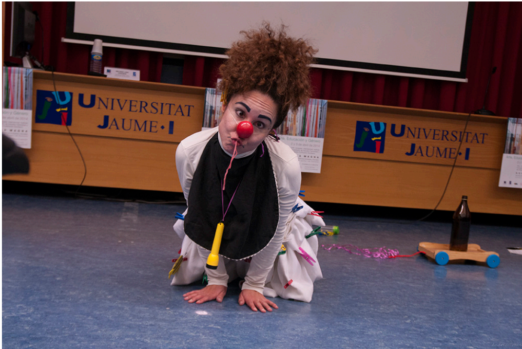
Fotografía independiente. Traver, Andrea (2014) Xoxo Clown Show

infancia inspiradas en las vidas y experiencias de dos mujeres contemporáneas: la coreógrafa y bailarina alemana Pina Bausch y la bióloga y Premio Nobel de la Paz Keniana Wangari Maathai. La dramaturga, «apuesta por otra manera de contar, de presentar el mundo. Otra manera posible, que pretende presentar menos estereotipos y ofrecer una mayor variedad de temas, situaciones, lenguajes y personajes, y en particular, empleando un lenguaje que apuesta por mostrar y poner en valor el cuerpo» (Itziar Pascual, 2014). Así pues, el teatro se revelará como dispositivo de experiencias creativas en la composición de personajes femeninos. Puesto que las consecuencias que genera la ficción en esta etapa son especialmente relevantes en la construcción de roles de género.