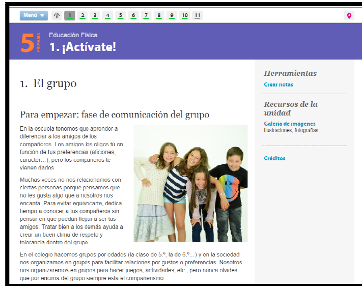
Imagen nº 6. Plataforma Netex-Educación Física

En el aula virtual de Netexlearning podemos acceder al contenido tanto para el alumno como el profesor.