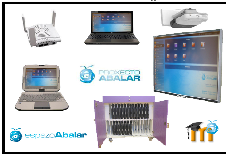
Figura nº 2. Elementos del aula Abalar

En estos momentos estamos participando en el proyecto de carácter experimental de EDIXGAL (84 centros en toda Galicia), una plataforma de aprendizaje virtual en la cual los alumn@s acceden a contenidos curriculares "completos y gratuitos" facilitados por la Xunta, así como a aquellos elaborados por los propios docentes en los centros educativos.