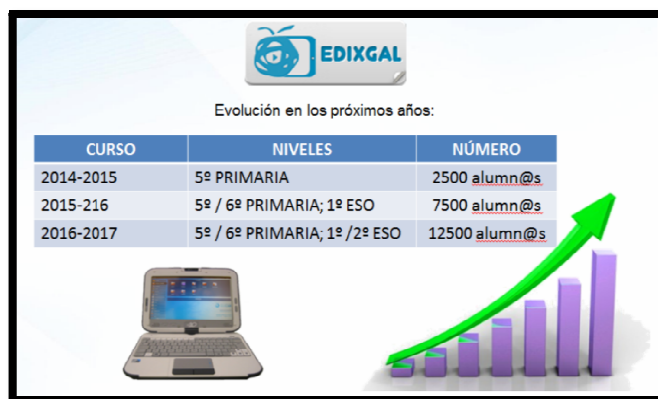
Imagen nº 1. Evolución de Edixgal en Galicia.

El proyecto Educación Digital (E-DIXGAL) tiene como objeto favorecer la incorporación generalizada de las tecnologías de la información y de la comunicación (TIC) en el desarrollo de la actividad educativa, facilitando a los centros adscritos a la red Abalar la disponibilidad de libros y otros materiales digitales con los que puedan desarrollar su proyecto en la totalidad del currículo de 5º de Educación Primaria en el curso 2014-2015, ampliándose a otros cursos y etapas en los años siguientes.