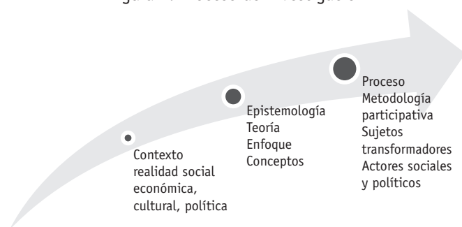
Figura 1. Proceso de investigación

que contemplan: en el primer año, la fase de documentación bibliográfica sobre métodos y metodologías en el diseño y la formulación de diagnósticos sociales para la fundamentación teórico-metodológica del proyecto. En la segunda fase, del segundo año, se planteó la revisión de experiencias novedosas en diagnósticos sectoriales o temáticos en lo social, económico, cultural o político con participación comunitaria e incidencia territorial en Bogotá y otras regiones del país. En el tercer año, la fase tercera de experiencia de formulación y aplicación de diagnóstico participativo en un territorio como experiencia piloto de validación y ajuste de la propuesta. Y para el cuarto y quinto año, fase última del proyecto, poner al servicio de las regiones la aplicación de la metodología con acompañamiento, formación y seguimiento a las poblaciones para su gestión (figura 1).