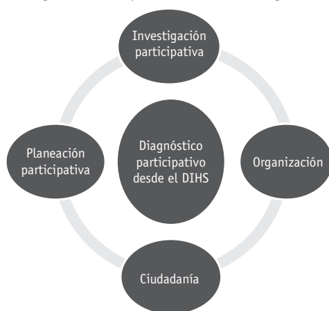
Figura 2. Componentes metodológicos

Dentro de este contexto, los diagnósticos participativos promoverán procesos de organización y participación ciudadana para la planeación del desarrollo y el fortalecimiento de la cultura participativa a partir del interés, la voluntad y la decisión de los sujetos por actuar colectivamente en el logro de unas mejores condiciones de vida que preserve los recursos y perdure en las generaciones futuras (figura 2).