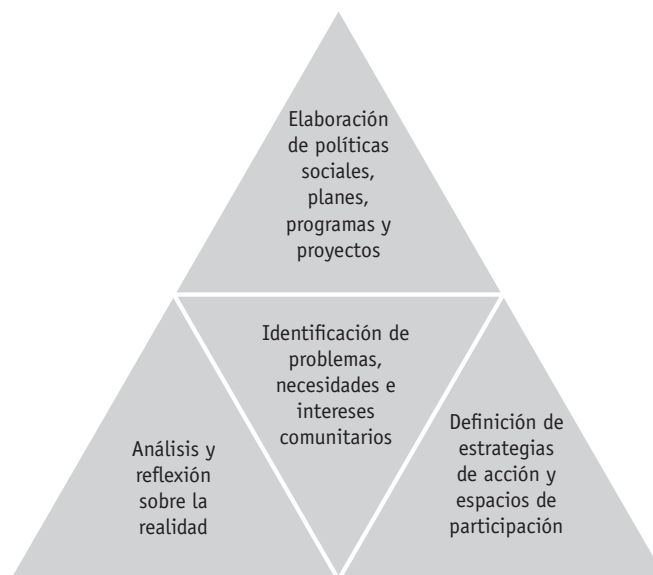
Figura 3. Diálogos ciudadanos: participación de actores sociales

Así, la búsqueda de un desarrollo más humano, integral y sustentable sería la promoción de sujetos participativos desde el ejercicio de sus libertades y responsabilidades a partir de los derechos fundamentales y la actuación plena de sus deberes. Un desarrollo equitativo, justo y participativo que favorezca el círculo virtuoso , y no el círculo perverso de la exclusión y la violencia. Un desarrollo que propicie la paz perpetua de Kant, porque sin desarrollo no hay paz, y sin paz el Estado social de derecho no puede progresar como marco para el ejercicio de la ciudadanía participativa, autónoma, ética y socialmente responsable. La figura 4 muestra los procesos de la propuesta de construcción de diagnósticos participativos con los actores presentes en los territorios.