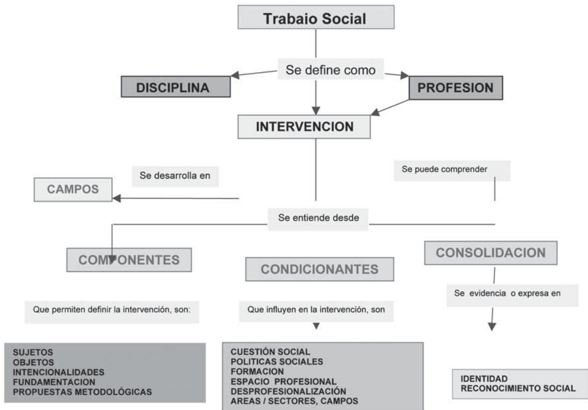
Figura 2. Mapa conceptual para comprender holísticamente la intervención profesional de TS 6

el carácter relativo, perspectivo del conocimiento, para comprender y proyectar de forma pertinente y significativa la intervención (Cifuentes, 1998). En Trabajo Social el profesional se inserta directamente en la realidad social, involucra un saber científico, académico, disciplinar, intuitivo y valorativo (Olaya y otros, 2008). A continuación se presenta el mapa conceptual que sintetiza una propuesta de comprensión compleja de la intervención profesional de Trabajo Social, como aporte al proceso de reconfiguración: incluye distinciones, en la perspectiva de visualizarla integralmente, como profesión como aporte a la construcción disciplinar.