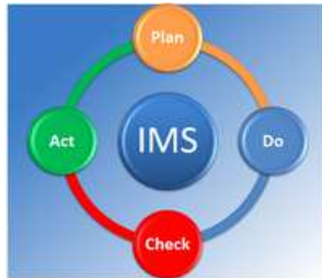
1. Gráfico. PDCA. [5]

Las siglas, PDCA son el acrónimo de Plan, Do, Check, Act (Planificar, Hacer, Verificar, Actuar).