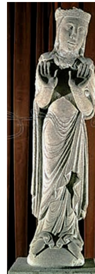
Sepulcre de la reina Violant d'Hongria. Monestir de Vallbona de les Monges.