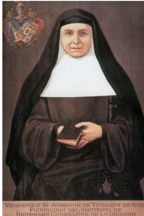
Fotografia original de Santa Joaquina Vedruna feta per Moliné Albareda. Barcelona, 1853.