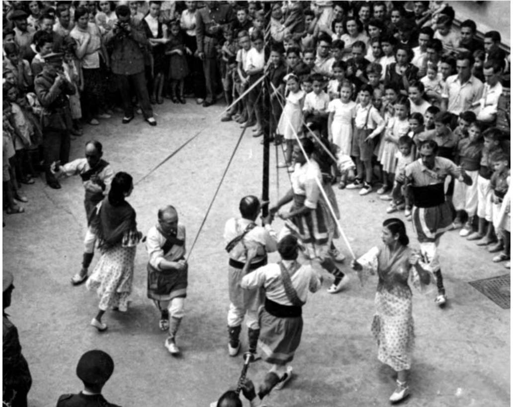
Tarja postal. Vilafranca del Penedès. Ball de Gitanes.

gunes paraules per a significar la seva complaença, però el bullici no en deixà oir cap. Acabades que foren les cortesies dels paers, el rei, sense esperar que els balls finissin llurs actuacions, donà ordre de partir i els cotxers obeïren tan promptament i llençaren la carrossa a tanta velocitat, que tot fou desbaratat, i els del Consell havien de fer córrer les cavalcadures al galop, de tal manera que la distància d'hora i mitja fou salvada en menys de tres quarts." (DURAN, 1963, p. 14-15).