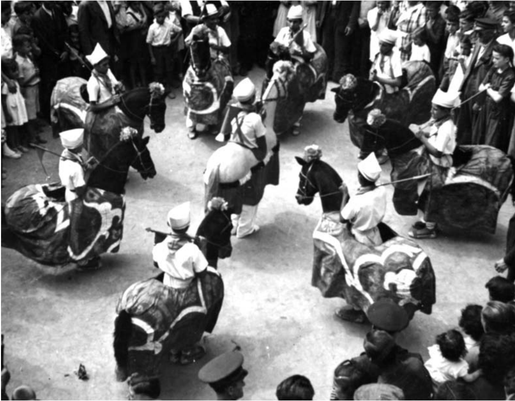
Tarja postal. Vilafranca del Penedès. Ball de cavallets.

d'una lluita entre cristians i turcs que tingué lloc el vint-i-sis de març de 1724, en la continuïtat de les festes de proclamació de Lluís I. Diu el cronista de la Relacion de los festivos aplausos... : "Por la tarde huvo la diversion de los quatro Dances, que en diferentes puestos de la Ciudad hizieron prueba de su destreza, y agilidad, sin faltarles sequito, ni aplauso. Entrada la noche se encendieron las parrillas por toda la Ciudad, que fuè bastante luz para los exercicios, que se hizieron en ella. Formaronse dos Companias de Granaderos de cinquenta hombres cada una, con su Capitan, y demàs Oficiales, todos bien vestidos, y armados; ivan los de la una con trage Turquesco, Turbantes, Medias Lunas, y Ballestas; la otra era de Christianos uniformamente, y con gallardia vestidos, armados con Fusiles, Gorras, Cartucheras, y Bolsas para las Granadas; la Musica se componia de Abueses, y Caxas; unos, y otros arrojaron dulces en gran abundancia. Salieron estas dos Companias de distintos puestos, y aviendo tenido de reencuentro algunas escaramuzas por las calles, que con bizarro denuedo se executaron; se encontraron despues en la Rambla, en donde estava prevenido un gran Castillo de Fuego; este era guardado de los Turcos, y queriendo acometerle los Christianos, fueron la primera vez rechazados, y prosiguiendo en querer assaltarle, se travò reñidissima Batalla, que la hazia formidable, y divertida el mucho fuego, que arrojavan, y el estruendo Militar