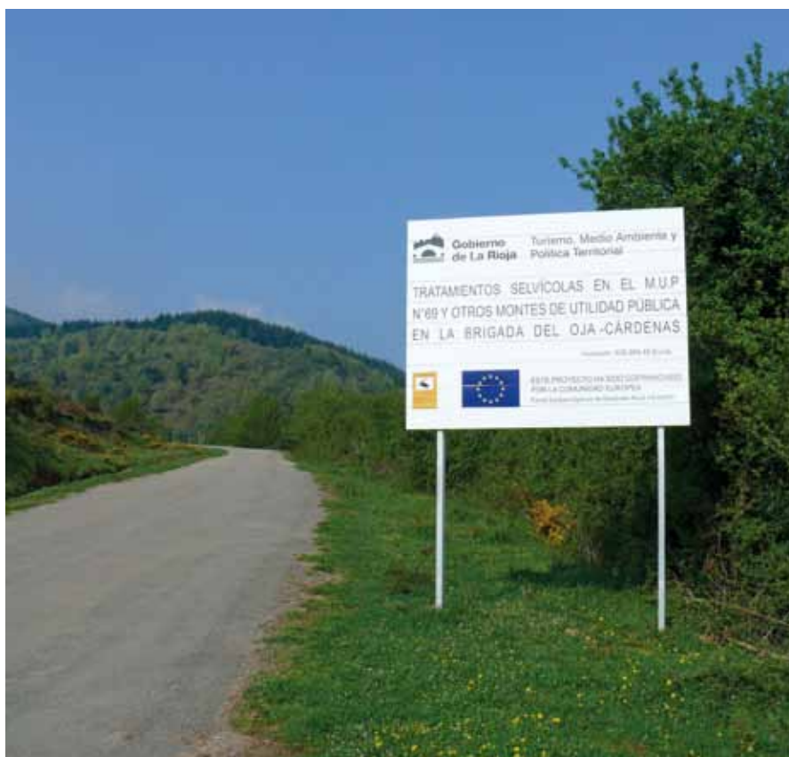
La UE ha elaborado una serie de normas sobre publicidad e información de los proyectos financiados con Fondos Europeos.

Medio Natural participa exclusivamente en el Eje 2, en el que se financian, por un lado, actuaciones dirigidas a la protección de la biodiversidad y la conservación de Espacios Naturales Protegidos mediante