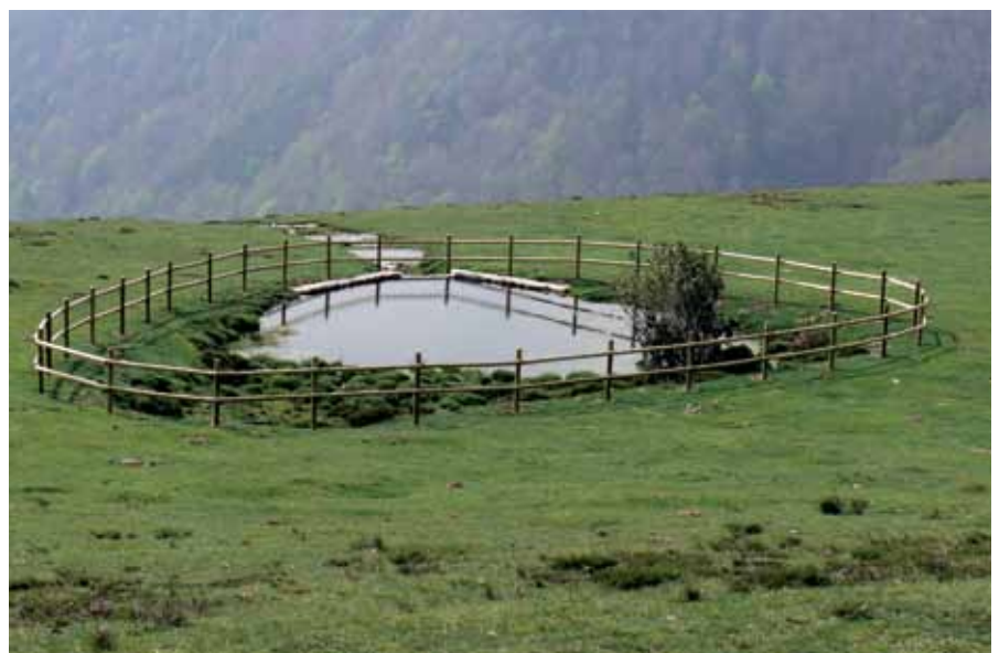
El proyecto de creación y acondicionamiento de balsas para anfibios cuenta con apoyo del FEADER.

En La Rioja, actualmente el FEADER se hace cargo del 27,70 % del coste de las medidas que gestiona Medio Natural. El MARM colabora en algunas medidas como la construcción y mejora de pistas forestales, las actuaciones de protección de fauna en pequeños espacios naturales, las subvenciones para la primera forestación de tierras agrícolas, los trabajos de prevención de incendios o las acciones de conservación y de-