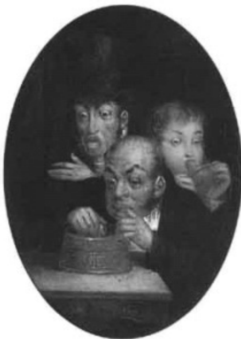
Lam. 11.- Pecado Capital . Dionisio Fierros. Óleo sobre lenzo.48, 26 x35, 56cm. Colección particular.