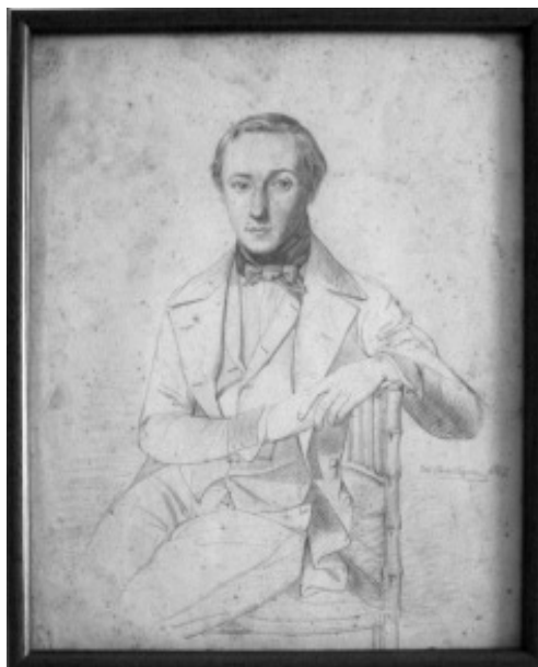
Lám. 1.- Retrato de Dionisio Fierros. Manuel Castellano. Lápiz sobre papel. 1847. Colección particular.

De esta primeira etapa artística do pintor, considerada de «formación» 7 coñecemos moi pouco.