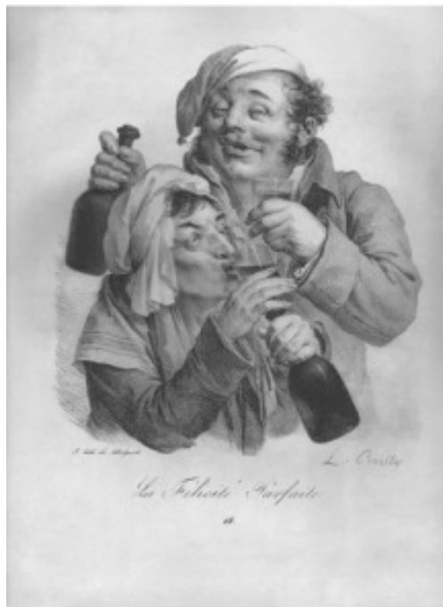
Lám. 6.- La Felicité Parfaite . L.L.Boilly. Litografía en papel vitela, coloreada a man. 22,3x32,4 cm. Taller de Delpech París. 1827.