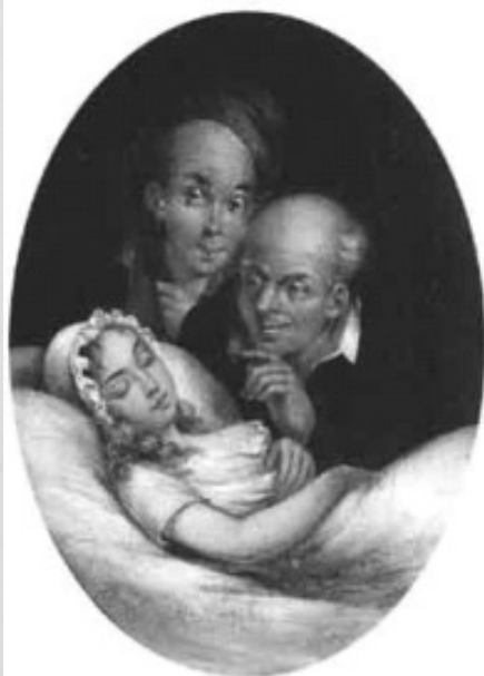
Lám. 9.- Pecado Capital . Dionisio Fierros. Óleo sobre lenzo. 48,26 x 35,56 cm. 1852. Colección particular.