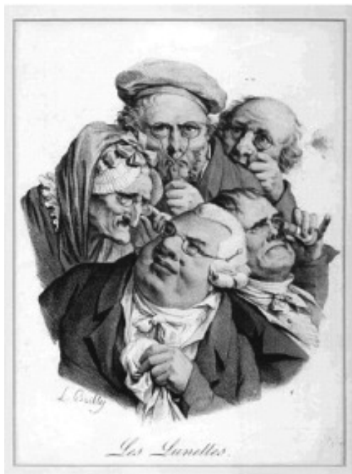
Lám. 4.- Les Lunettes . L.Boilly. Litografía en papel vitela, coloreada a man. 22,3 x 32,4cm. Taller de Delpech. París 1827.