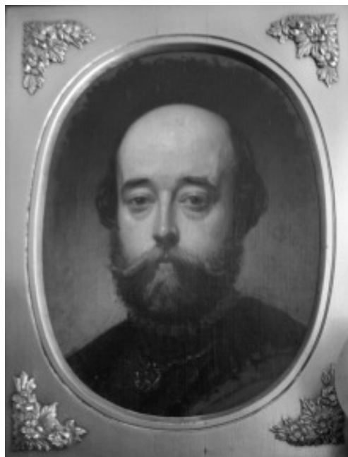
Lám. 3: Retrato de cabaleiro (Cabaleiro do S.XVII, ¿Vestido á antiga?). Dionisio Fierros. Óleo. 60x45cm. Colección particular.

Este cadro, posiblemente inspirado nalgún autor do S XVII, mostra xa a inclinación do autor por captar os detalles e plasmar a fisonomía dun xeito moi realista. Inda que carece de data, pode pertencer a esta primeira etapa polas súas características (Notable academicismo, pincelada apretada, luz frontal etc) e tamén