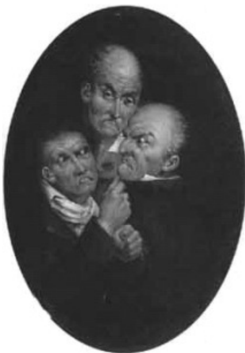
Lám.13.- Pecado Capital. Dionisio Fierros. Óleo sobre lenzo.48, 26 x 35,56cm. 1852. Colección particular.

artistas clásicos e reinterpretando distintas obras, tratando diversas temáticas para conseguir un estilo propio.