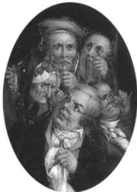
Lám. 5.- Pecado Capital . Óleo sobre lenzo. 48,26 x 35,56 cm. 1852. Colección particular.

O debuxo moi marcado, a luz uniforme e a cón pouco degradada, cun predominio dos tons pastel, dalle unha sensación de planimetría potenciada pola rotundidade do debuxo. Na obra de Dionisio Fierros, de formato oval inda que a composición é practicamente igual, aparte de utilizarse distinto soporte técnico, o que nos daría outra textura e aparencia, hai un tratamento diferente.