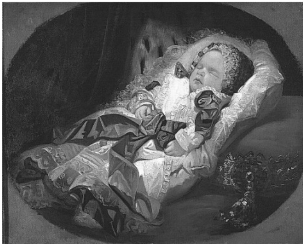
Lám. 2: Retrato Xacente do Infante D.Luis de Borbón y Borbón. Dionisio Fierros. Óleo sobre lenzo.

Sábese que até 1855 estivo tomando clase de pintura e ligado ó taller de Federico de Madrazo.