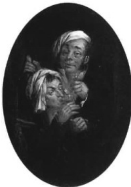
Lám .7.- Pecado Capital . Dionisio Fierros. Óleo sobre lenzo.48,26 x 35,56 cm. 1852. Colección particular.

De novo vemos que Fierros partindo da obra de Boilly supera a esta no tratamento conseguendo ademais, suprimida esa exaxeración dos rasgos unha maior elegancia e proporción de formas, dándolle profundidade á escena.