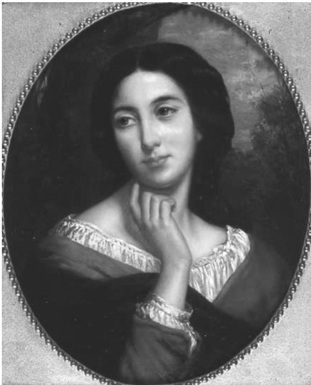
Lam 14: Retrato de Xoven. (Retrato feminino de busto con fondo de paisaxe). Dionisio Fierros. Óleo sobre lenzo. Ca 1850. Museo Casa Natal de Jovellanos, Gijón.

Con el quero expresar unha vez máis a miña grande admiración por este gran pintor, non sempre debidamente valorado, que foi un dos artistas mellores e máis completos do noso s.XIX, posuidor así mesmo dunha gran calidade humana.