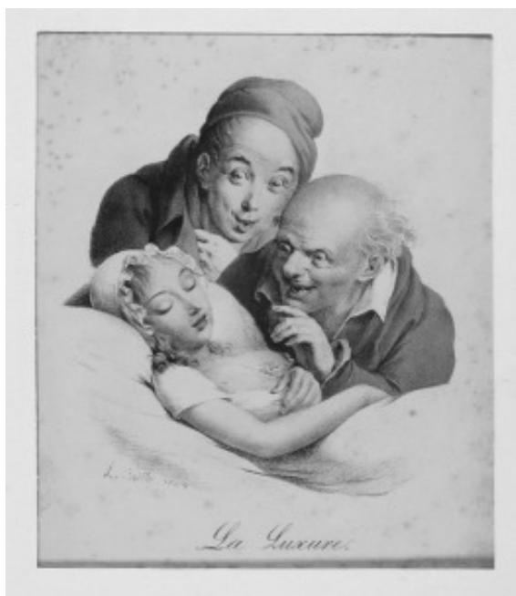
Lám. 8.- La Luxure . L.L. Boilly. Litografía. En papel vitela coloreada a man. 22,3x32,4cm. Taller de Delpech. París.