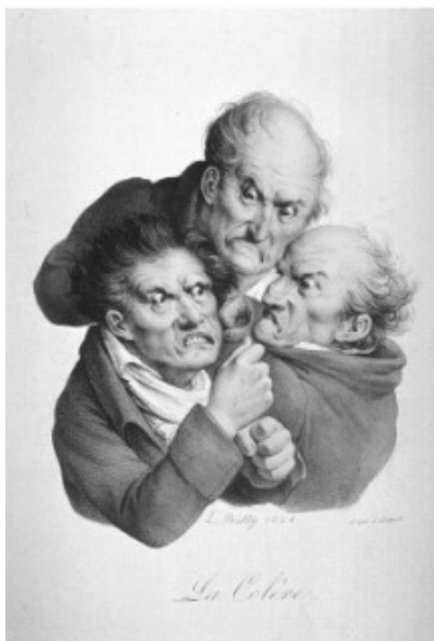
Lam. 12.- La Colère. L.L Boilly. Litografía en papel vitela coloreada a man. 22,3x32, 4. Taller de Delpech. París. 1824.