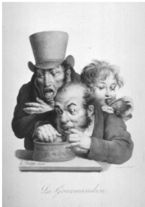
Lam. 10.- La Gourmandise . L.L.Boilly. Litografía en papel vitela coloreada a man. 22,3x32, 4cm Taller de Delpech. París 1824.