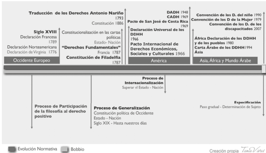
Grafica 4. Línea del tiempo-evolución jurídica

humanos sea la positivización, siendo los mecanismos de protección y de sanción las constantes preocupaciones del mundo de hoy. Por ello se considera que la concepción evolutiva fijada por Bobbio y que finalmente da lugar a la Gráfica 3 responde mucho más a una evolución constante y por etapas.