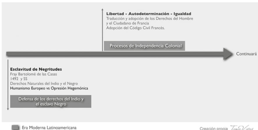
Grafica 3. Línea del tiempo de los DDHH (continuación)

Aunque para algunos especialistas en materia de derechos humanos, como es el caso del profesor Travieso, se considere que “desde el punto de vista jurídico, la historia de los derechos humanos se encuentra dirigida especialmente a los hechos y a su consolidación normativa, o sea, la positivización” (Travieso, 2013, p. 9). Posición claramente respetable, sin embargo, la situación actual de violación generalizada de derechos humanos nos impide considerar que el propósito que mueva al mundo de los derechos