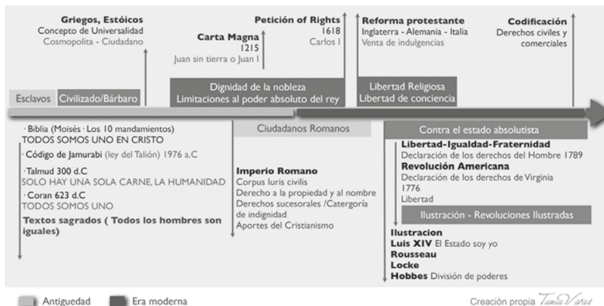
Gráfica 2. Línea del tiempo de los DDHH

Finalmente, la línea del tiempo al asociar el corpus iuris civilis con los procesos de levantamientos indígenas, intenta generar asociar los eventos históricos con el proceso de evolución de los derechos humanos. Son ese tipo de asociaciones las que pretenden crearse a través de la propuesta de la línea del tiempo, notoriamente visibles en la Gráfica 2.