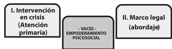
Figura 1. Representación del vacío de empoderamiento psicosocial

de riesgo psicosocial que posee la población de mujeres sobrevivientes de violencia y del comercio sexual 3 , en cuanto a la necesidad de empoderamiento psicosocial para alcanzar una mejor calidad de vida y hacer uso de los recursos personales y sociales a favor de su bienestar personal.