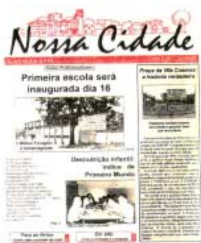
Figura 3: Jornal Nossa Cidade .

Na primeira página do jornal Nossa Cidade (Fig. 3), o código escrito, fotografias, desenhos e recursos de cor estão entre as formas de representação que são utilizadas em sua composição. Cada artigo destacado é composto por uma combinação de pelo menos três dessas formas.