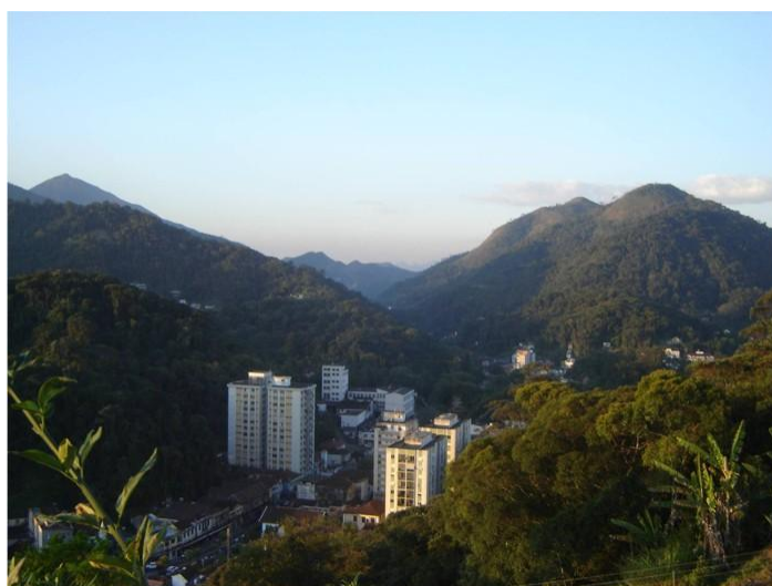
FIGURA 4 – Vista panorâmica da cidade