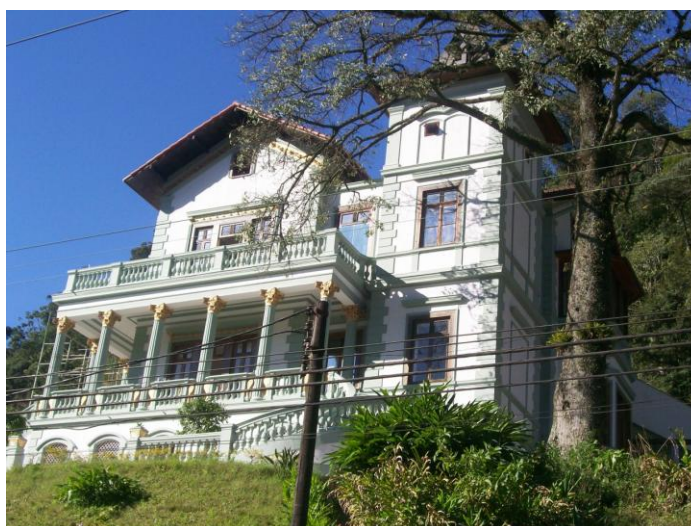
FIGURA 1 – Casa fotografada pela Júlia

“Tem uma casa antiga que eu sempre vejo quando vou para a escola”. (Júlia)