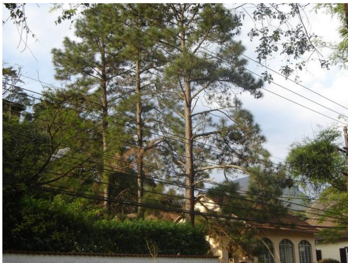
FIGURA 3 – Árvore fotografada por Rafaela