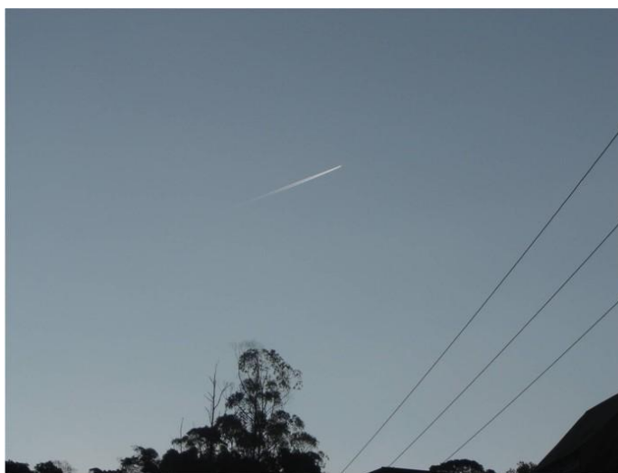
FIGURA 5 – Um avião

Benjamin (1994, p.104) ressalta que: “Cada um de nós pode observar que uma imagem, uma escultura e principalmente um edifício são mais facilmente visíveis na fotografia que na realidade”. A partir desta análise, podemos deduzir que um prédio histórico presente na rotina da criança passava a ser um “novo” prédio, posto que é submetido a um novo olhar. Essa “nova” representação da cidade, por essas imagens, perpassa a visão cotidiana. Esse aspecto foi observado também durante a exposição das fotografias no saguão de um centro comercial, onde os visitantes se surpreenderam com as imagens de determinados lugares comuns e próximos a suas residências, mas ignorados no dia-a-dia.