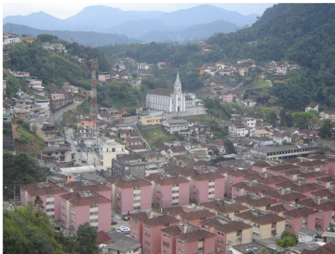
FIGURA 2 – Bairro Alto da Serra

A escolha das crianças a respeito desses lugares que desejavam retratar vai ao encontro do que nos diz Benjamin (1994, p.103): “Nenhuma obra de arte é contemplada tão atentamente em nosso tempo como a imagem fotográfica de nós mesmos, de nossos parentes próximos, de nossos seres amados”.