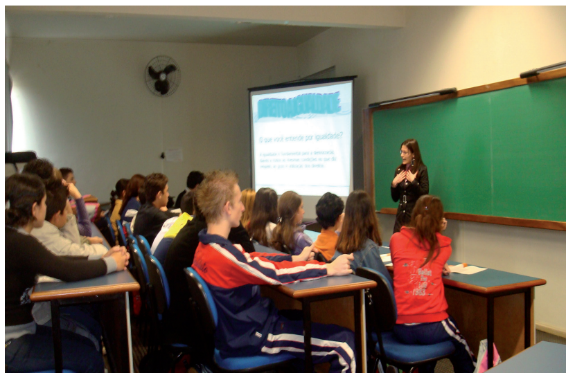
Figura 1 – Acadêmica faz explanação sobre os direitos fundamentais

A metodologia utilizada consiste na realização de encontros com a duração de em média 4 horas/aula em uma instituição de ensino previamente contatada, alternando-se em instituições da rede pública e da rede privada, tendo sempre como temática os direitos fundamentais que fazem parte do projeto.