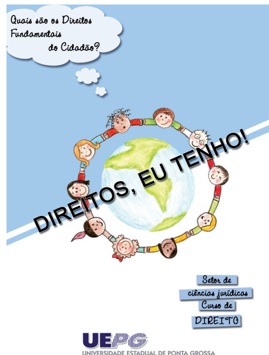
Figura 2 – Capa da Cartilha elaborada pelos membros do Projeto de Extensão “Direitos, eu tenho!”

Esse material é explorado durante os debates, serve de subsídio para as dinâmicas e também de veículo de difusão do conteúdo abordado, pois todos retornam as suas casas com um exemplar para mostrá-lo aos seus parentes mais próximos e amigos do meio social em que vivem.