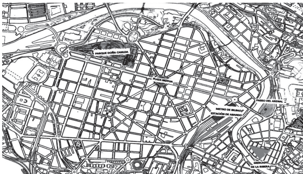
IMAGEN 1 PLANO PARCIAL DE BILBAO CON LOS LUGARES DONDE SE HAN REALIZADO LAS OBSERVACIONES

Fuente: elaboración propia. Plano cedido por el Área de Urbanismo, Ayuntamiento de Bilbao.