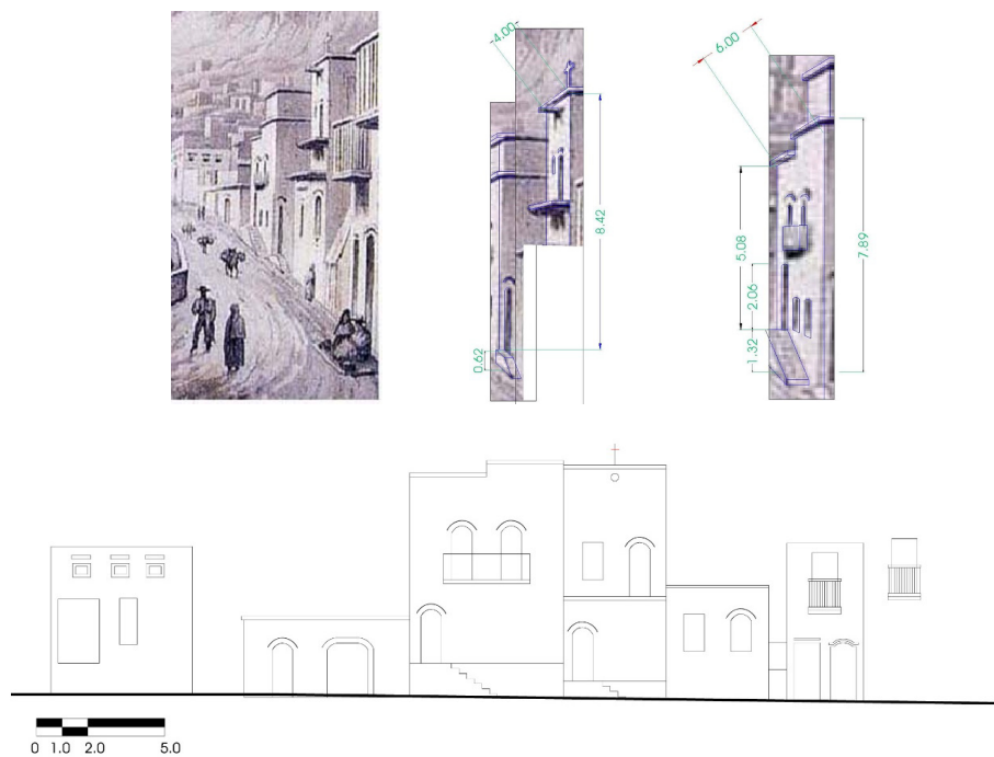
Figura 6. Tipología retomada de Ward, que representa un orden tipológico en la Avenida. Elaborado por Edith Hernández López, junio 2012.

Cannigia describe el “tipo” como el producto de una conciencia espontánea, haciendo una analogía con la persona que habla, indicando que en el constructor existe la tipología antes de realizar una casa, y en el otro, existe antes del habla. Es un código, un patrimonio colectivo, presente y actuante en la mente de cada uno, para el que edifica y para el que disfruta lo edificado. Refiere sobre el proceso tipológico en el cual describe: Si se examinan varios tipos de edificación no contemporáneos, en una misma área cultural, descubrimos una progresiva diferenciación de éstos, más apreciable entre tipos distantes en el tiempo, y menos visible si son leídos en intervalos próximos. (Cannigia & Luigi Maffei, 1995). Situación que se presenta en la Avenida Juárez al estudiar la litografía de Ward, en la cual observamos una tipología con elementos no tan diferentes, debido a las cercanías temporales de su construcción (ver Figura 6).