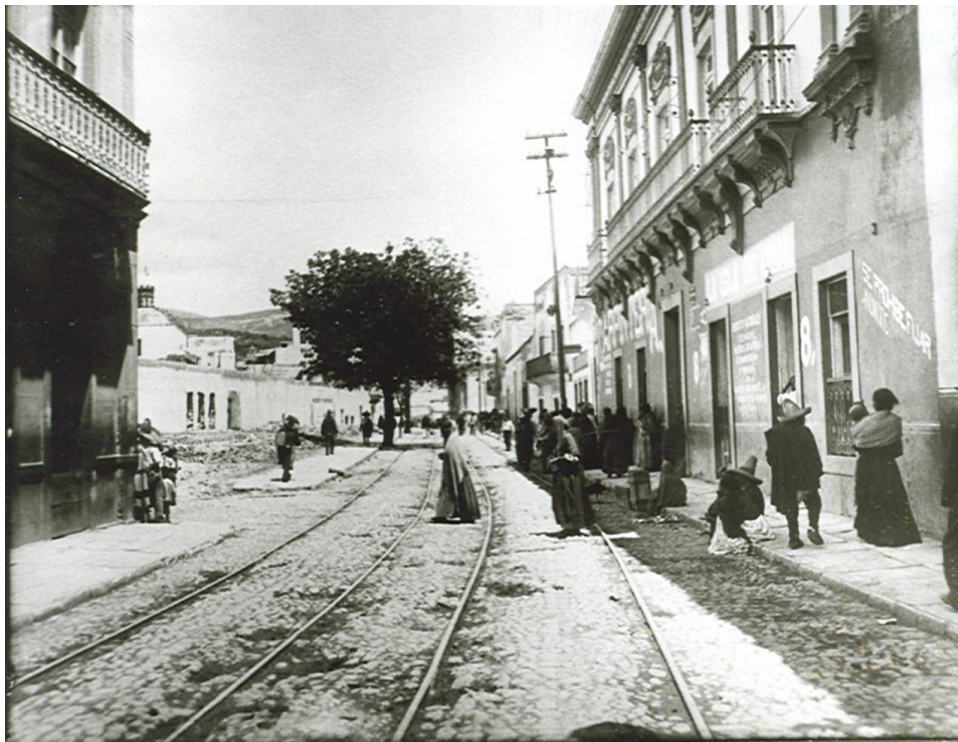
Figura 4. Fotografía histórica de la Av. Juárez en 1910.

(1998). La Avenida Juárez presenta contenidos tipológicos representativos para el centro histórico de Guanajuato (ver Figura 5).