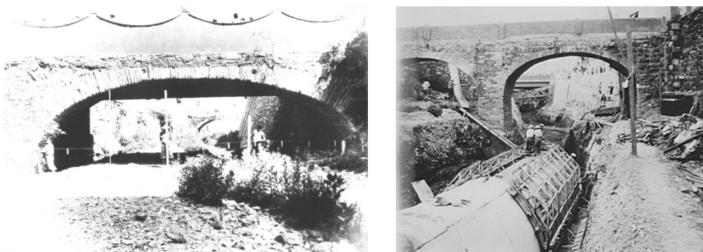
Figura 1. Río de Guanajuato (izquierda) antes de las obras de embovedamiento (derecha) en el tramo que en la época virreinal se conocía como Calzada de Nuestra Señora de Guanajuato y que hoy está conformada por dos niveles: a nivel del río Av. Miguel Hidalgo y sobre el atierre de las casas Av. Juárez.

A pesar de la idea que prevalecía de vivir temporalmente en estas tierras mientras se hacían ricos para regresar a su país , resultó contradictorio, pues a pesar de las continuas inundaciones catastróficas 1 , el arraigo hacia la mina, y quizás también, a los imaginarios producto de riquezas generadas, o ilusiones de bienestar, contribuyeron a persistir y realizar las obras pertinentes para lograr su habitabilidad deseada, como fue la decisión de levantar el nivel de las calles de la ciudad sepultando sus casas. Las principales transformaciones que se observan ocurrieron durante los siglos XIX y XX, y son: el atierre de las casas, la construcción de puentes para cruzar a ambos lados del río durante época de lluvias –y que en la actualidad se encuentran tan integrados a los pavimentos que son irreconocibles–, el embovedado del río –primero a la altura del nuevo nivel de la ciudad– generado tras el atierre de las casas, y después al embovedar las aguas para hacer tránsito vial el cauce del río (Ver Figura 1).