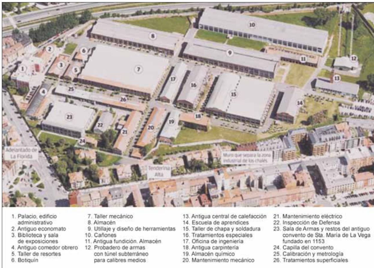
FIG. 8. Distribución de la Fábrica de Armas de Oviedo.

los años noventa del siglo pasado y la destrucción de los talleres de Santo Domingo y las estaciones de Jovellanos y de Económicos propició la concentración ferroviaria en la estación de Renfe, mediante una operación urbanística denominada, a lo postre con sarcasmo, Cinturón Verde. La ambición por apropiarse de las plusvalías urbanísticas de los espacios liberados de los ferrocarriles produjo miles de viviendas y aparcamientos subterráneos en una reforma interior de la ciudad burguesa sin precedentes. Pero no quedó ni rastro de las cajas ferroviarias que hubieran permitido su transformación en senda peatonal con carril para bicicletas.