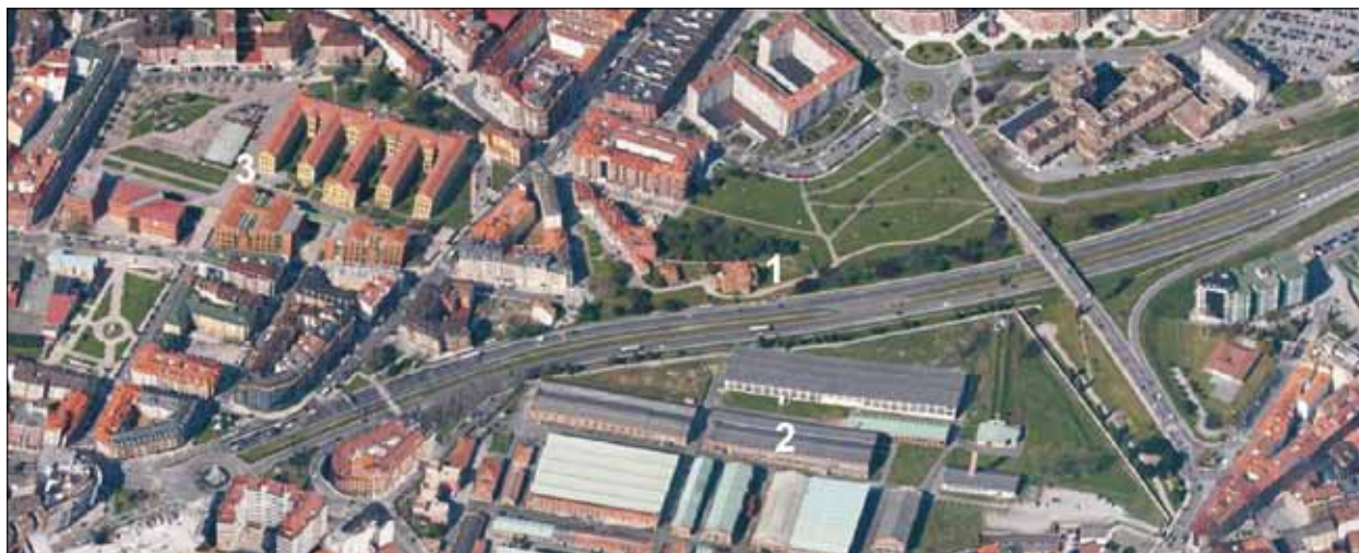
FIG. 2. Parque San Julián de Los Prados. Al borde de la entrada en la ciudad de la autopista de la «Y», se localiza este parque del barrio de Teatinos, cuya denominación proviene de la iglesia prerrománica de San Julián de Los Prados (1), declarada por la Unesco Patrimonio de la Humanidad. Al otro lado de la autopista, que afecta de manera muy negativa al monumento prerrománico y a los barrios del E de Oviedo, se observa la Fábrica de Armas (2), ya abandonada, y su composición ortogonal. En el ángulo superior izquierdo, se localiza el Campus de Humanidades de la Universidad de Oviedo (3) y el parque que, como el propio Campus, recibe el nombre de El Milán, tomado del cuartel militar que ocupó con anterioridad los edificios universitarios.

desde el siglo XIII, al convento de San Francisco, que ocupaba el solar de la actual Junta General del Principado de Asturias, componían un conjunto de huertos, jardines y bosque que pasaron a convertirse en parque. No obstante, una parte de los mismos se cedió en 1846 por el municipio a la universidad como jardín botánico.