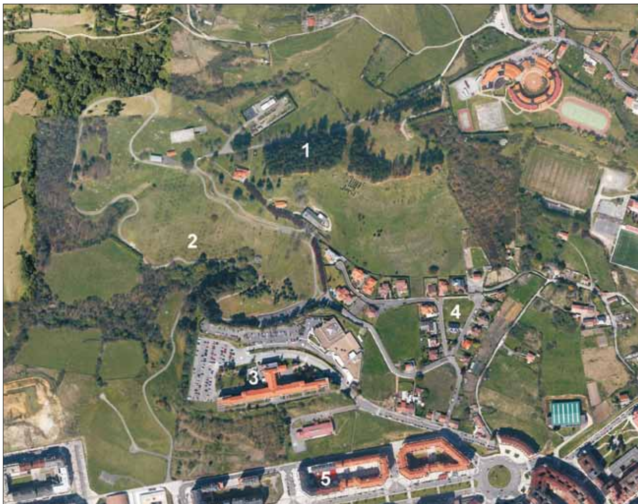
FIG. 6. El Parque Purificación Tomás se localiza en la falda del monte Naranco, al NW de la ciudad. En su morfología es posible apreciar el parcelario rural original y sus usos: el pinar de Monte Altu (1), las pomaradas de la parte baja (2), y los prados. El límite meridional del Parque, que se sitúa en la parte más baja de la ladera, está formado por usos urbanos: Hospital Monte Naranco (3), vivienda unifamiliar (4) y barrio de La Florida (5), de reciente construcción. Elaboración propia. Fuente Google Maps .

hórreo gallego. Algunas de estas edificaciones presentan un aspecto deteriorado (el hangar, por ejemplo), que le da al parque un cierto aire de abandono, a lo que contribuye también su aislamiento con inadecuados accesos.