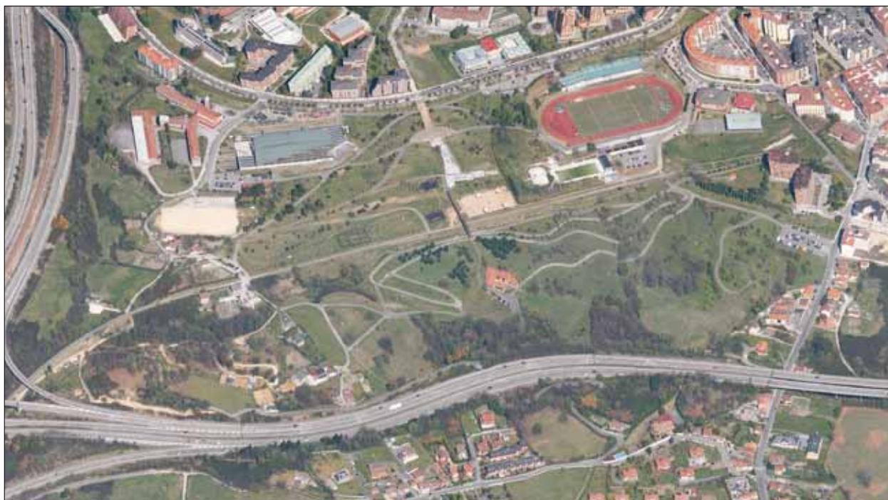
FIG. 4. El Parque de Invierno se extiende al S de Oviedo, entre la ciudad y la autovía A-66 (Autovía de La Plata). La línea longitudinal que lo cruza por su parte central se corresponde con la antigua vía férrea (ferrocarril Vasco-Asturiano), transformada en senda peatonal, con carril para bicicletas. En el contacto con la ciudad, destacan las instalaciones deportivas. Fuente Google Maps .

viviendas de clase media alta, se intercalan con equipamientos universitarios (campus de los Catalanes, con los colegios mayores y la guardería infantil) y sociales (casas de acogida), además de un colegio público y otro privado.