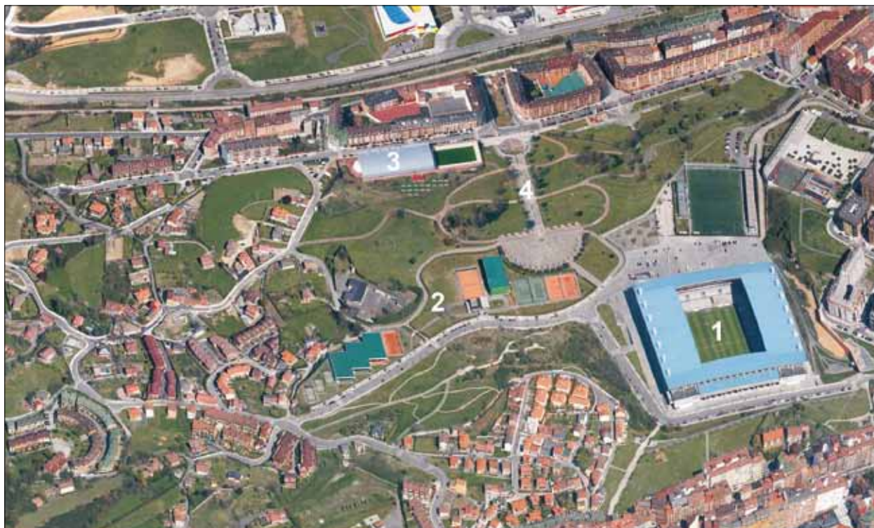
FIG. 5. Parque del Oeste. En las inmediaciones del campo de fútbol Nuevo Carlos Tartiere, y entre los barrios de La Erfa (a la derecha de la imagen), Olivares (parte inferior) y La Argañosa (parte superior), se ha desarrollado este parque, de función primordialmente deportiva: campos de fútbol (1), instalaciones para deportes de raqueta (2) y piscina cubierta (3). En el centro, plaza, fuente y escalinata (4).