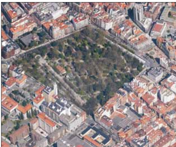
FIG. 1. El Campo de San Francisco, en el centro de Oviedo. En su parte izquierda se observa el Paseo del Bombé. Sus límites rectilíneos proceden de los «ensanches» decimonónicos.

de La Zoreda, muy poco frecuentado por los ovetenses pese a su gran atractivo.