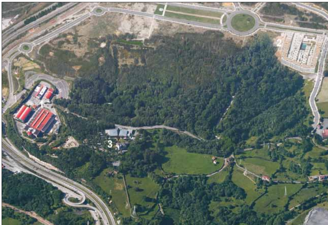
FIG. 7. Bosque de La Zoreda. Al SW del concejo de Oviedo se localiza esta mancha de bosque atlántico en cuyo interior se alojaban los polvorines de la desaparecida fábrica de explosivos de La Manjoya, bordeando los caminos que se aprecian en el interior de la masa arbórea. A la izquierda, destaca la línea sinuosa de la autovía A-66 y la edificación de la Fundación Laboral de la Construcción (1); en la parte superior, el bulevar de la macroubanización que la crisis ha reducido a los bloques del ángulo superior derecho (2); y hacia el centro, la casa de la familia Sela, transformada en hotel-restaurante con el nombre comercial de Castillo de La Zoreda (3).

del gran espacio ajardinado de la cima de la colina, se levantó un edificio funcional, de gran capacidad, para bodas y banquetes.