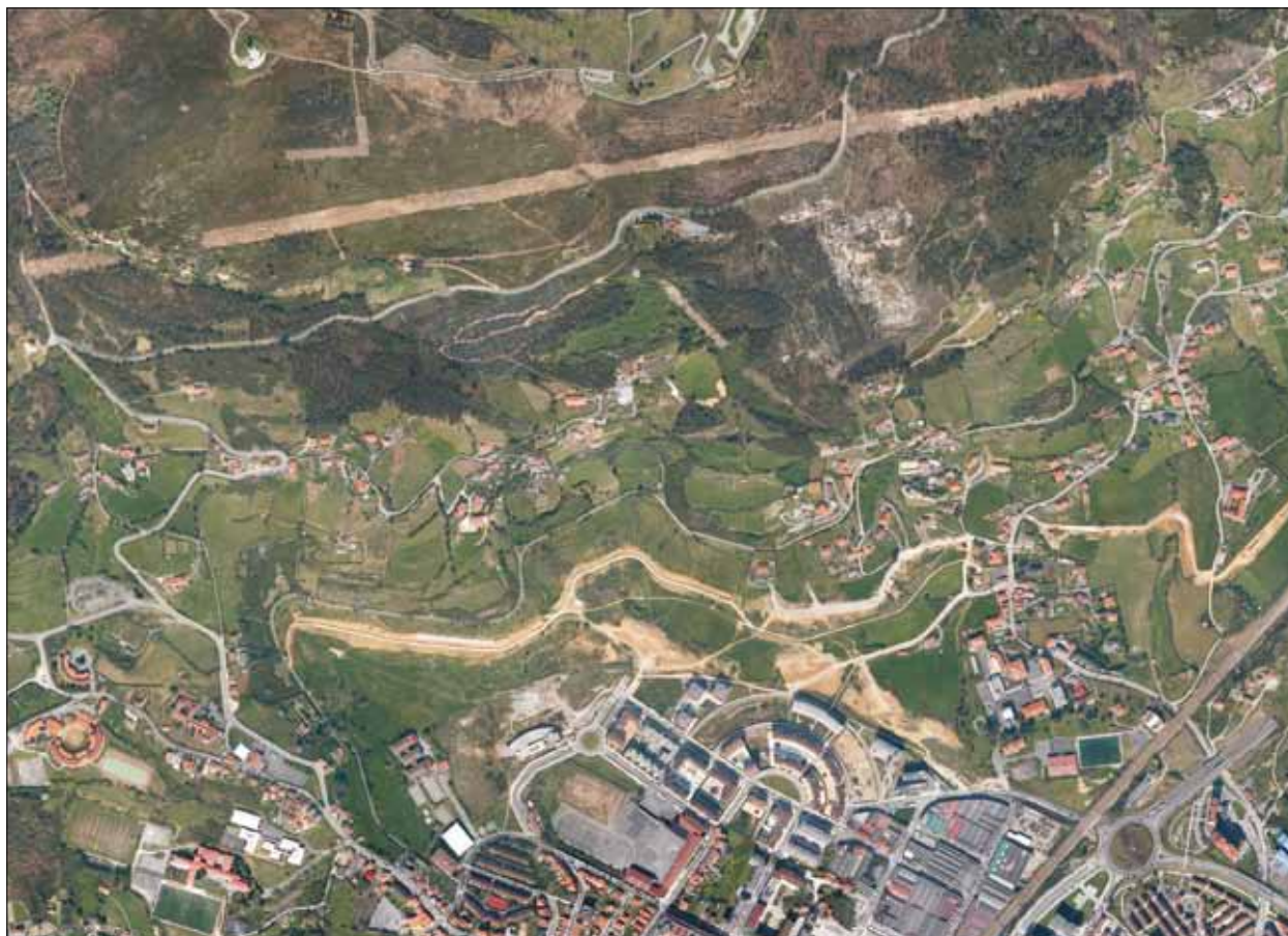
FIG. 3. Prados de La Fuente. Es un parque en construcción en la ladera del monte Naranco entre la «pista finlandesa» (antiguo ferrocarril minero), correspondiente a la línea sinuosa de la parte superior de la imagen (la línea recta es un pasillo desbrozado de un tendido de alta tensión) y las recientes promociones de viviendas (Prados de La Fuente) en el barrio de Ciudad Naranco.

y expuestos a las brisas (Quirós, 2009, pp. 204-206). Pero, en Oviedo, no eran necesarios en razón del clima.