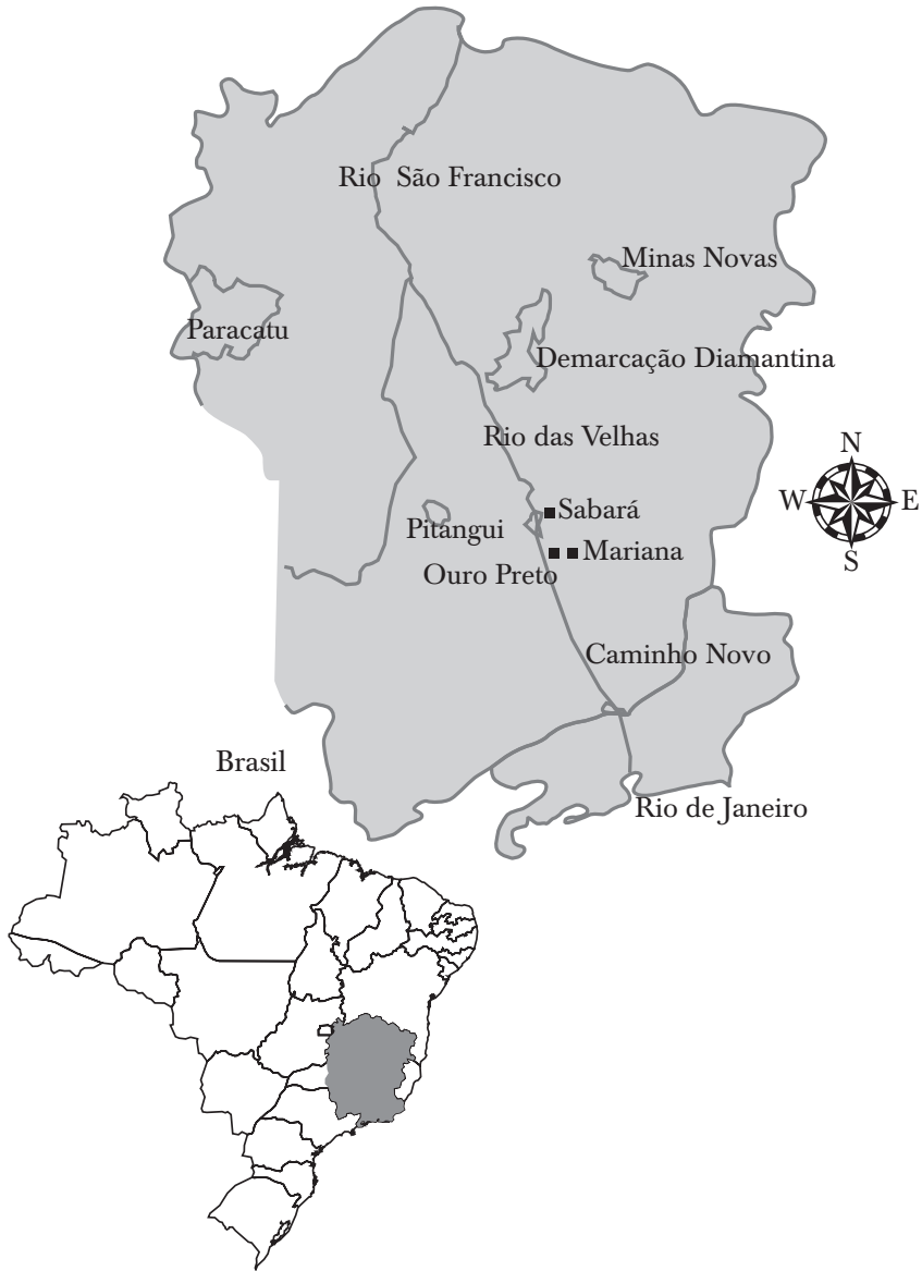
MAPA 1. CAPITANIA DE MINAS