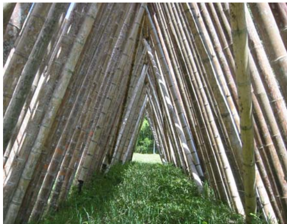
Figura 2. Secado al aire libre, ubicación en perchas, en forma de tijera.