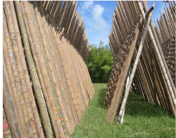
Figura 1. Secado al aire libre, ubicación en perchas, proyecto secado de Guadua.

Con el resultado obtenido de la ecuación (2), se determinó el tamaño de la muestra de 10 unidades.