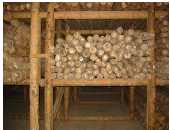
Figura 3. Secado bajo sombra, ubicación en estanterías en forma horizontal.