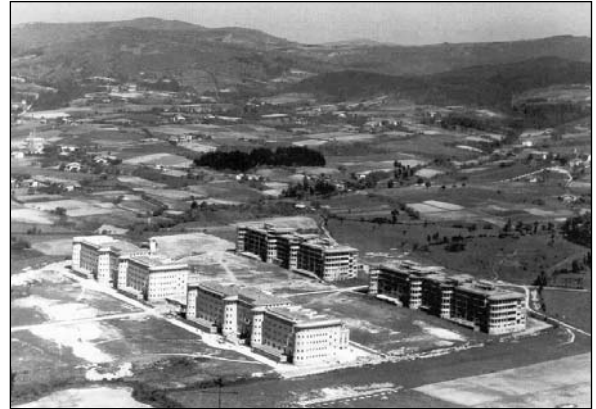
Edificios del manicomio proyectado cedidos por la Diputación para Seminario, 1950.

arquitecto provincial Diego Basterra, el proyecto cuyas obras comenzaron en 1932. Tras pleitos con los obreros, el derrumbe de pabellones, investigaciones por ello, incrementos de presupuestos y de operarios, la estructura de los cuatro grandes edificios quedó finalizada en agosto de 1934. El entonces manicomio de Zamudio estaba a punto.