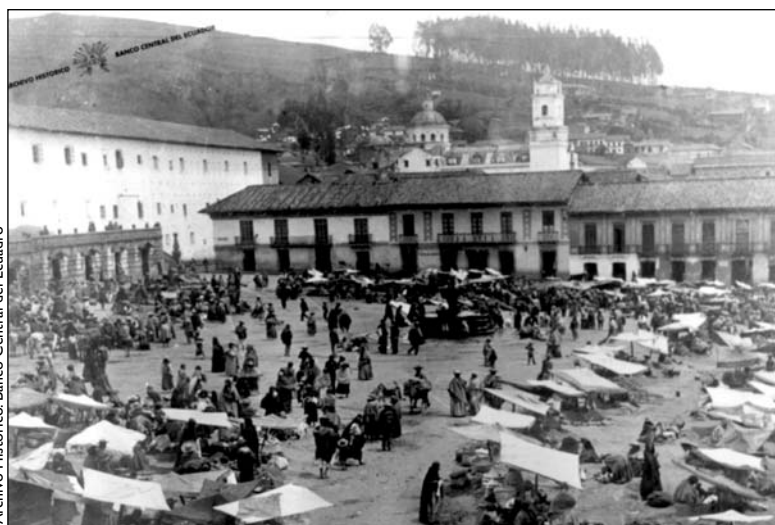
Quito, mercado en la plaza de San Francisco, hacia 1890

Concepciones diversas -y contradictorias- sobre la ciudad califican sus espacios y eligen el centro histórico como un espacio de reproducción cultural por excelencia. Es la vieja concepción de que hay una racionalidad en el organismo urbano, en donde ciertas áreas son de apropiación afectiva, aquellas que reconocemos con los posesivos “mi calle”, “mi barrio”, y donde también están otras áreas, aquellos no-lugares, cuyo ejemplo mayor es el centro de la ciudad, y dentro de él, la memoria, lo histórico. “Sin la ilusión monumental, a los ojos de los vivos, la historia no pasaría de ser una abstracción” (Augé 1994:68). Es en ese no-lugar, imposible de ser apropiado por los individuos pero que también es el lugar de