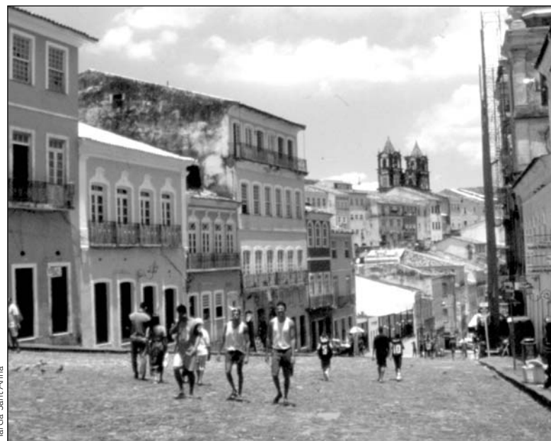
Vista del Pelourinho