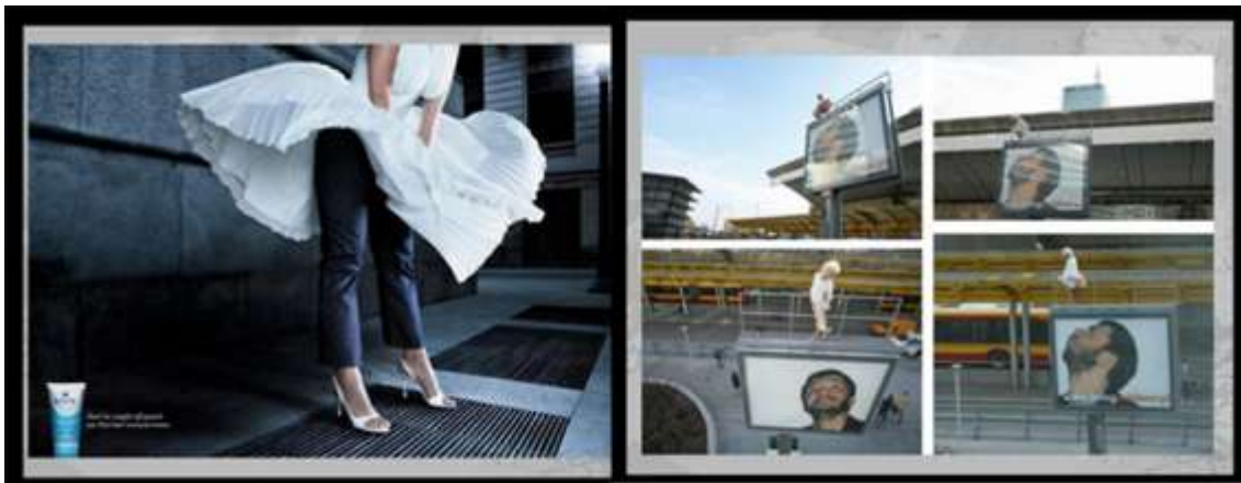
Figura 3. Comparación entre un anuncio gráfico de la marca Veet y una acción de marketing de guerrilla de la agencia de publicidad exterior Living Outdoor. En ambos se utiliza el personaje de Marilyn Monroe.

Aun así, no se debe olvidar que la evolución del marketing de guerrilla está ligada al surgimiento de nuevas tendencias, por lo que se estima que los cambios producidos dentro de la técnica se seguirán produciendo de manera continua.