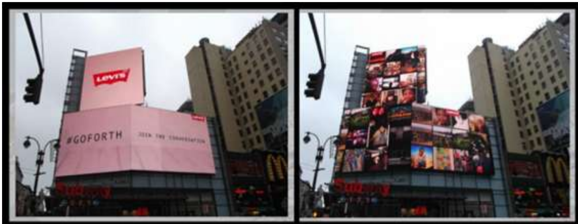
Figura 2. Acción de marketing de guerrilla de Levi's. Pantalla eléctrica publicitaria transformada en portafotos de los usuarios.

El marketing de guerrilla es resultado de una serie de cambios que se han producido en la sociedad, pero también es una herramienta que puede evolucionar [8]. Aunque su creación data del año 1987, la aparición de nuevos medios ha convertido en esta técnica en una de las más flexibles dentro del campo de la innovación. Además, se ha percibido una transformación considerable por parte de los soportes publicitarios convencionales, ya que a éstos últimos se le han dotado de utilidades diferentes. Un caso significativo es el de la marca de pantalones vaqueros Levi's, donde utilizó una pantalla eléctrica de publicidad y la convirtió en un portafotos gigante. El usuario, a través de las redes sociales de la marca, podía ubicar una fotografía dentro de este espacio. Ello provocó que la utilidad publicitaria del soporte se perdiera, dando un mayor protagonismo al consumidor potencial.