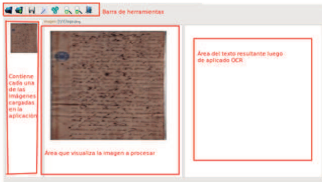
Gráfico 2. Delimitación de las áreas de DocLux OCR.

La aplicación cuenta con los siguientes requisitos funcionales: