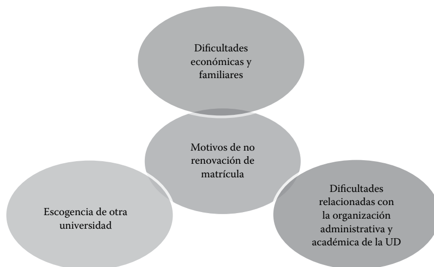
Figura 2. Motivos de no renovación de matrícula en la UD