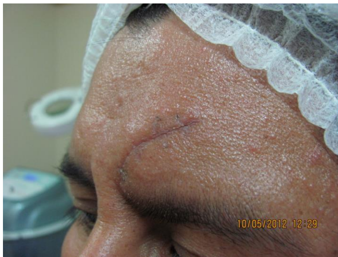
Fig. 1: Paciente caso 1 antes de inicio de carboxiterapia.