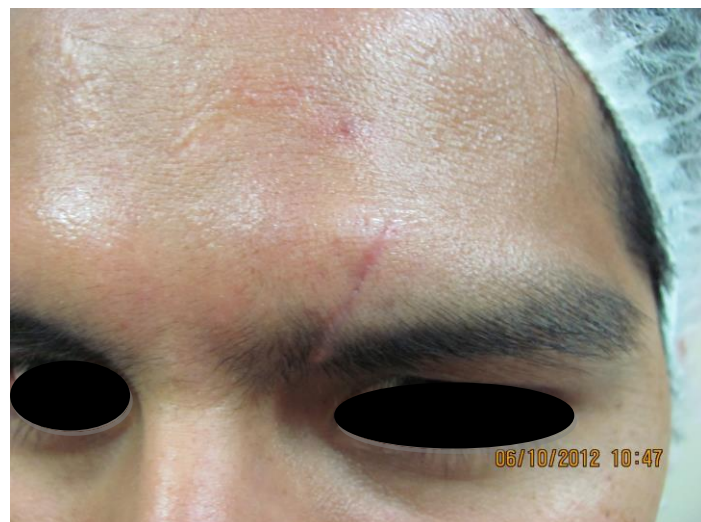
Fig. 4: Paciente caso 2, antes de inicio de tratamiento con carboxiterapia