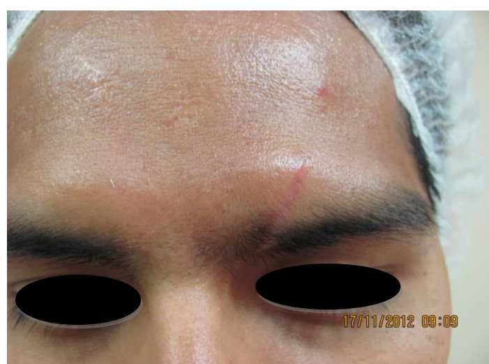
Fig. 5: Paciente caso 2, luego de 3 sesiones de tratamiento con carboxiterapia.