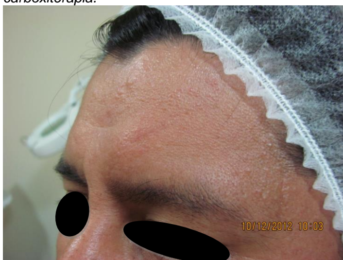
Fig. 3: Paciente caso 1, con 10 sesiones de carboxiterapia.

El efecto regenerador en piel, se explica a nivel de su efecto bioquímico en los tejidos (fig. 6), el año 2005 Irie et all demostraron por primera vez que el CO 2 favorecería la inducción local del factor de crecimiento del endotelio vascular o VEGF (por sus siglas en inglés), esto a la vez se asocia con la producción de óxido nítrico en endotelio el mismo que está relacionado con el efecto vasodilatador observado además de la movilización de células progenitoras endoteliales y formación de nuevos vasos (8), otros efectos benéficos del óxido nítrico en la reparación de heridas se han atribuido a su influencia en angiogénesis, inflamación, proliferación celular, deposición de la matriz y remodelación (9,10). Los resultados de ambos pacientes evidenciaron mejoría en la piel, con atenuación de la cicatriz inicial, con mayor rapidez y mejor resultado final en el caso de la herida más reciente. Los resultados coinciden con los hallados