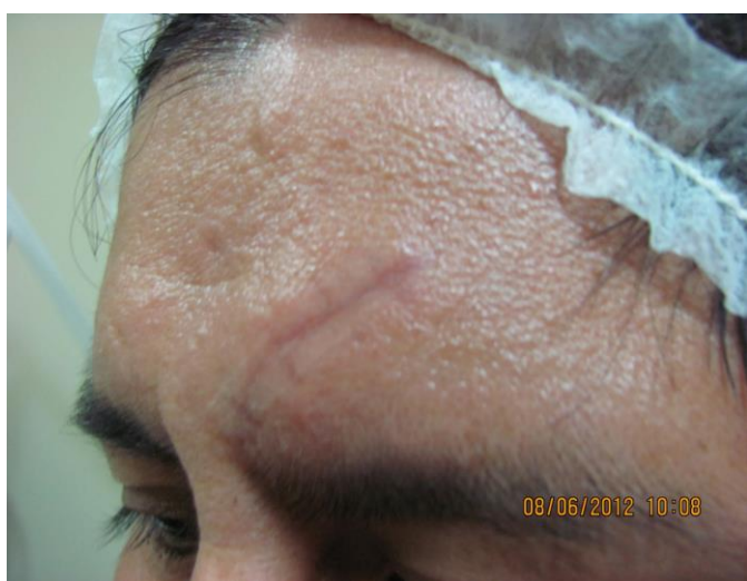
Fig. 2: Paciente caso 1, con tres sesiones de carboxiterapia.