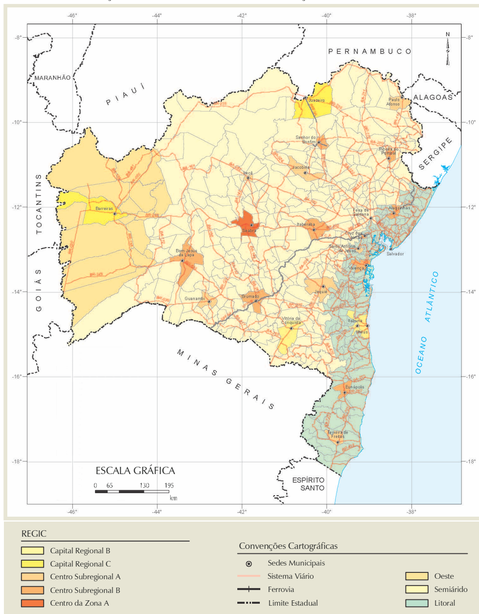
FIGURA 2 - LOCALIZAÇÃO DAS CIDADES MÉDIAS E CLASSIFICAÇÃO SEGUNDO O REGIC 2007 - BAHIA