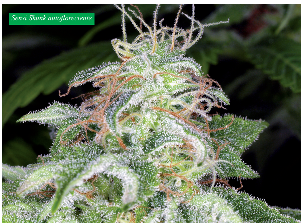
Sensi Skunk autoflorecente

Con el lanzamiento de Sensi Skunk en 1991, se hizo realidad la posibilidad de obtener cogollos de calidad superior de ese tipo, generalmente sólo asequibles para los que tenían presupuesto para variedades de alta calidad y experiencia cultivándolas. Además, este nuevo miembro de la ilustre familia Skunk presenta unas características tan diferentes de las de sus parientes que, prácticamente, creó una nueva categoría de Skunk Europea, cítrica y dulce, con fuertes notas dominantes de limón y una base de miel y almizcle. Las Skunk norteamericanas, de las que desciende Sensi Skunk #1, tienen un sabor más penetrante, menos dulce. Elegir una variedad u otra es, literalmente, una cuestión de gusto. Este sabor se ha conservado a lo largo de los años posteriores y ha hecho que Sensi Skunk ganara un premio en la Copa de la Marihuana (Marihuana Cup) de 2011 y una Mención Especial en la categoría de "sabor", veinte años después de que la variedad apareciese por primera vez en el mercado!