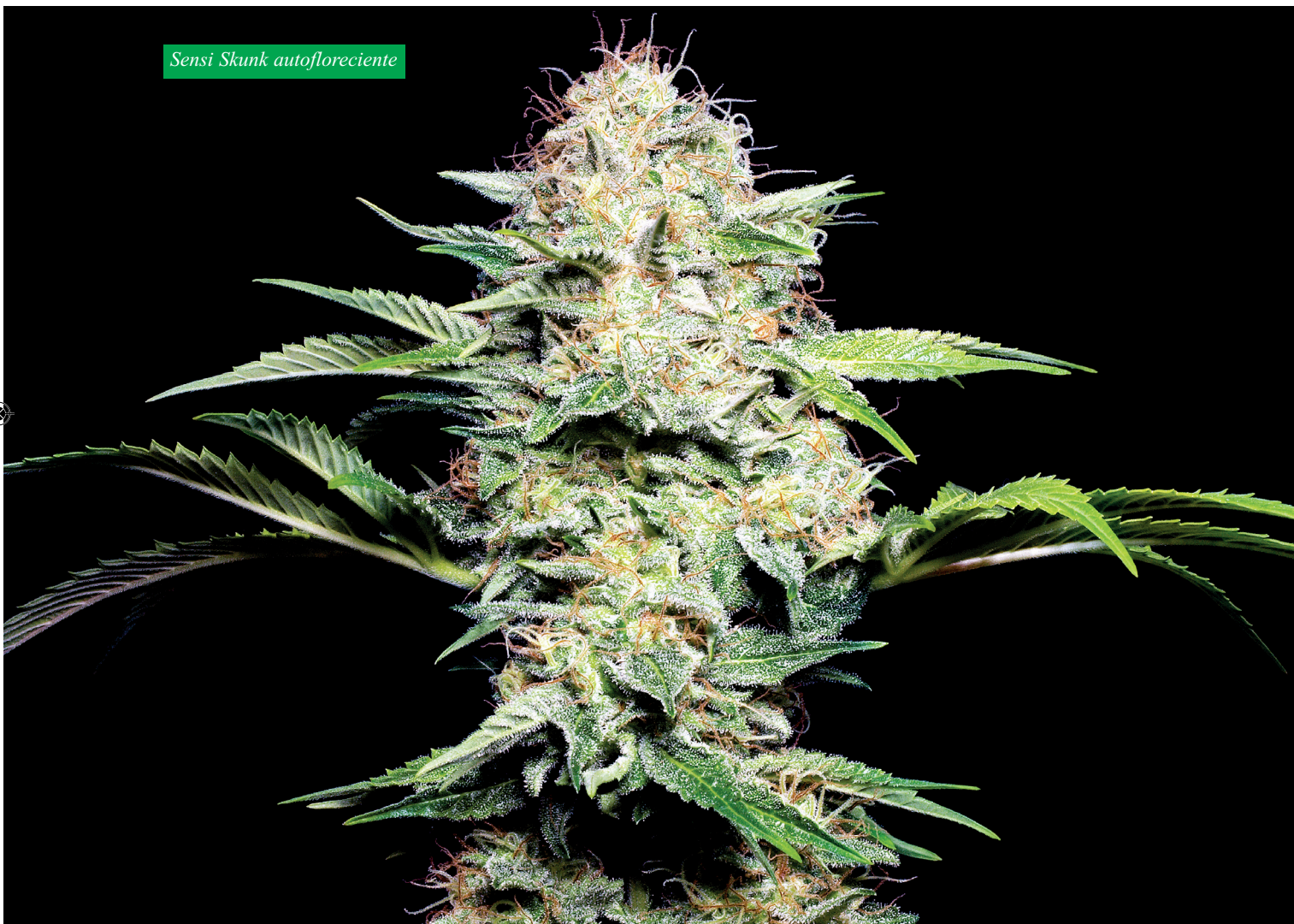
Sensi Skunk autofloreciente

El impulso para la legalización mundial del cannabis sigue siendo un esfuerzo a largo plazo y, sin duda, vamos a ver muchas batallas ganadas y perdidas antes de que la guerra contra las drogas haya terminado. Actualmente, Sensi Seeds tiene una gama tan amplia de variedades de cannabis que incluye, por lo menos, una variedad