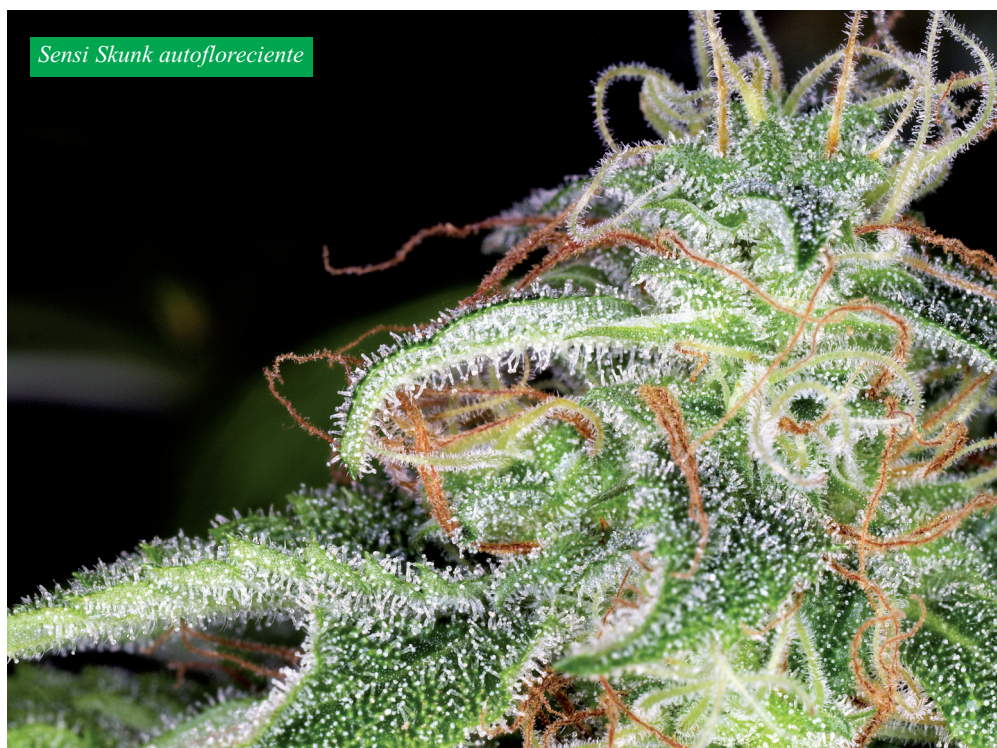
Sensi Skunk autoflorecente