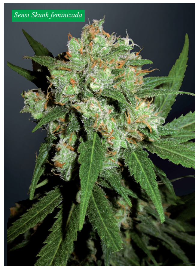
Sensi Skunk feminizada

N o hay duda de que la nueva gama de semillas feminizadas, que Sensi Seeds lanzó al mercado la primavera pasada, ha tenido un impacto muy positivo en la escena del cannabis. Ha puesto la genética, de algunas de las variedades de cannabis más apreciadas y famosas del mundo, al alcance de los cultivadores que prefieren trabajar con semillas que solamente proporcionen flores hembra. Todas las variedades galardonadas (Silver Haze, Big Bud, Jack Flash, Northern Lights y NL #5 x Haze) pueden presumir del éxito de sus versiones feminizadas de Sensi. Los aficionados a Skunk muestran una especial predilección por la versión feminizada de las famosas Skunk #1, Super Skunk, Shiva