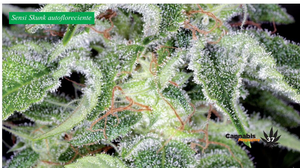
Sensi Skunk autoflorecente