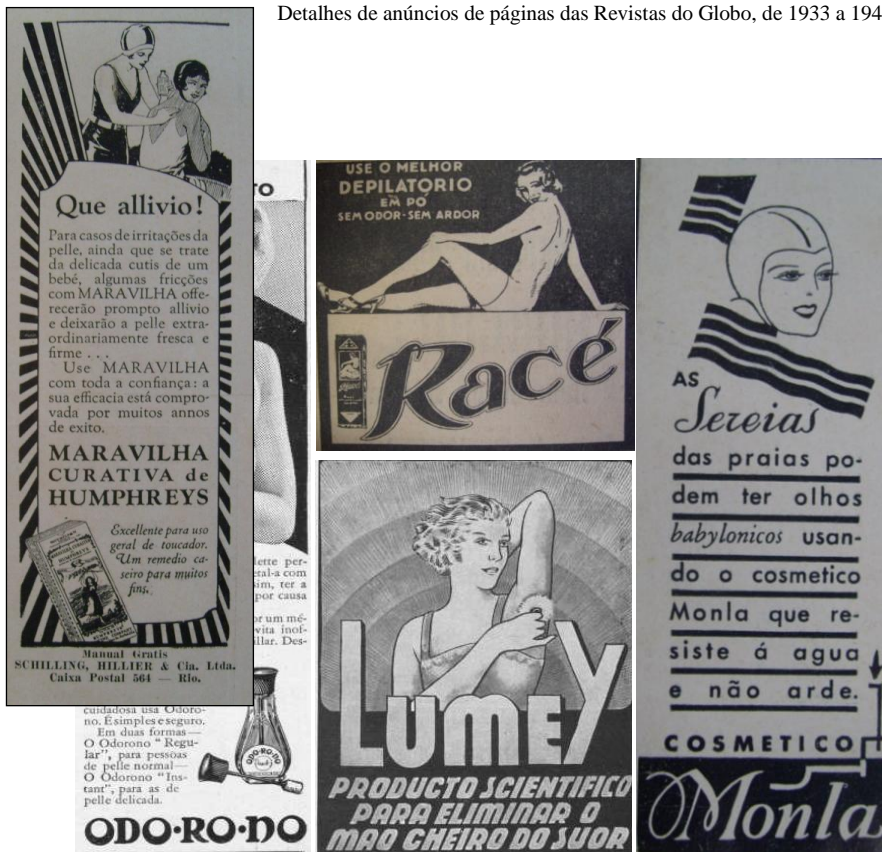
Detalhes de anúncios de páginas das Revistas do Globo, de 1933 a 1944.

Os sabonetes também abusavam nas propagandas prometendo higiene, suavidade e perfume. A barra de Sabonete de Reuter ilustra uma mulher jovem, de curtos cabelos em uma banheira de água, afirmando que o sabonete é uma “delícia