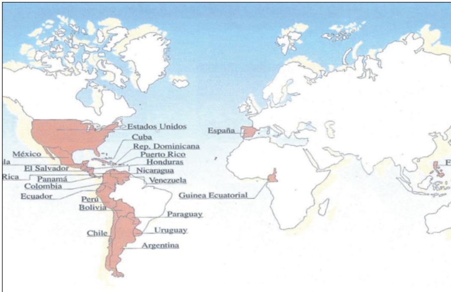
Imagen 2, el manual 'Español sin frontera', edición revisada de 2007.