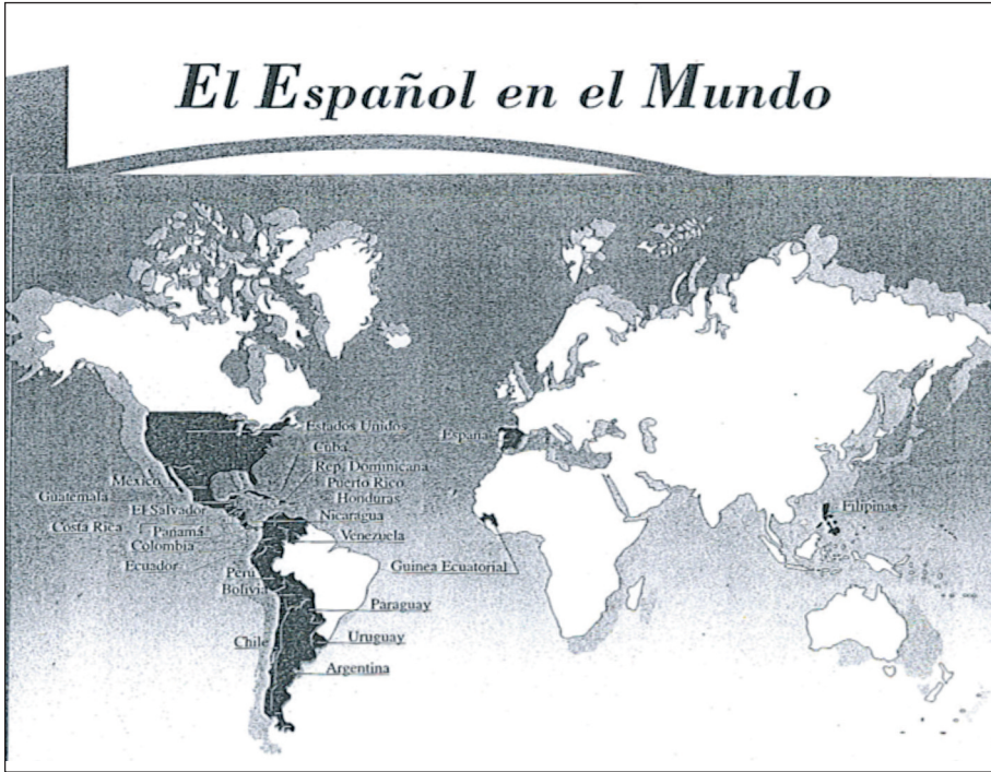
Imagen 1, el manual 'Español sin frontera', primera edición de 1997.