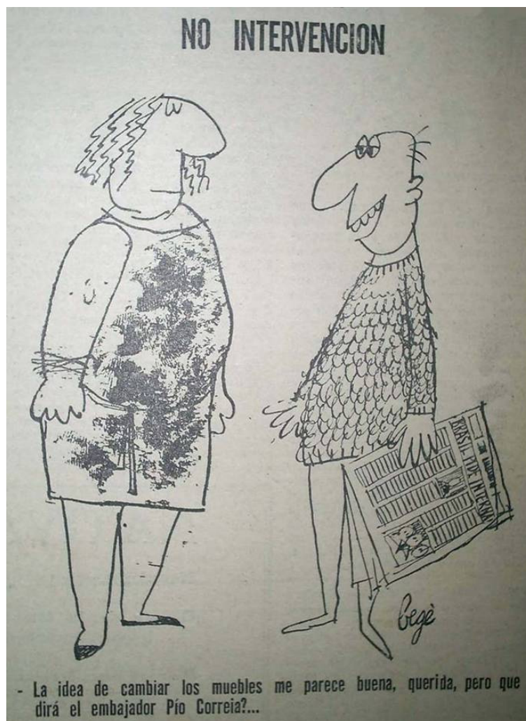
Imagem 2: “No Intervención”. Autoria desconhecida. Fonte: Extraído de GUTIÉRREZ, Carlos Maria. “Un pájaro que canta feo”. Marcha . Montevideo-UY. Año XXVI, n.º1239. Febrero 04 de 1965, p.32.

internación”, o marido responde à esposa que embora a idéia de trocar os móveis da casa o agrade, para tanto seria necessário pedir a permissão do embaixador brasileiro no Uruguai, Pio Corrêa. O exagero da resposta do marido é o principal motivo de riso, e denuncia o quão invasiva foi considerada essa exigência brasileira.