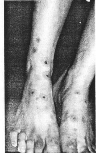
Fig. 3. Farmacodermia. Necrólisis epidérmica tóxica. Compromiso de mucosas y áreas extensas de desepitelización.